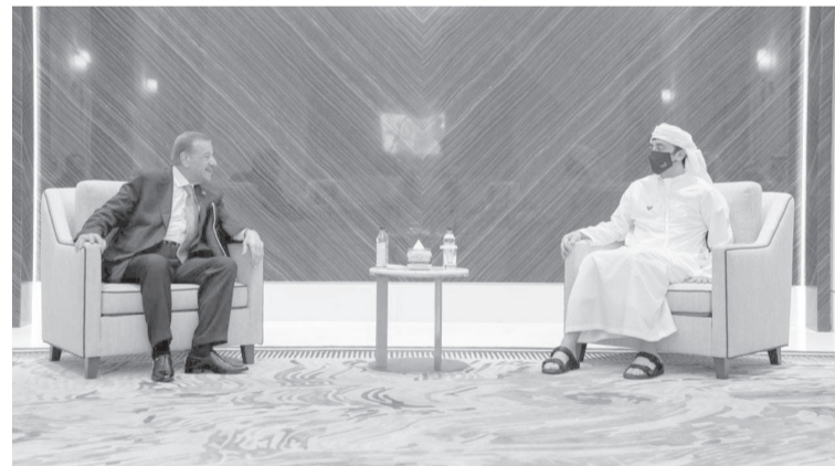
البلدين في مجالات الاقتصاد والبيئة والطاقة والمياه.