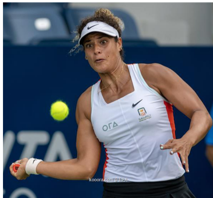
أمريكا - وكالات

المجموعات كانت: "0-6 2-6 3-6". في مباراة استمرت ساعتين وربع، وكانت لاعبة الفرانسة ثمنى النفس بالضيق بعيداً في البطولة حتى نتاج لها فرصة دخول عالم الـ50 الأوائل على مستوى التصنيف العالمي، وودعت ميار مؤخرًا بطولة مونتي تريو المفتوحة للنس، بعد خسارتها أمام الصنفة الـ5 عالمياً، الفرنسية كارولينا جارسيا بنتيجة 2/0 في الدور ربع النهائي.