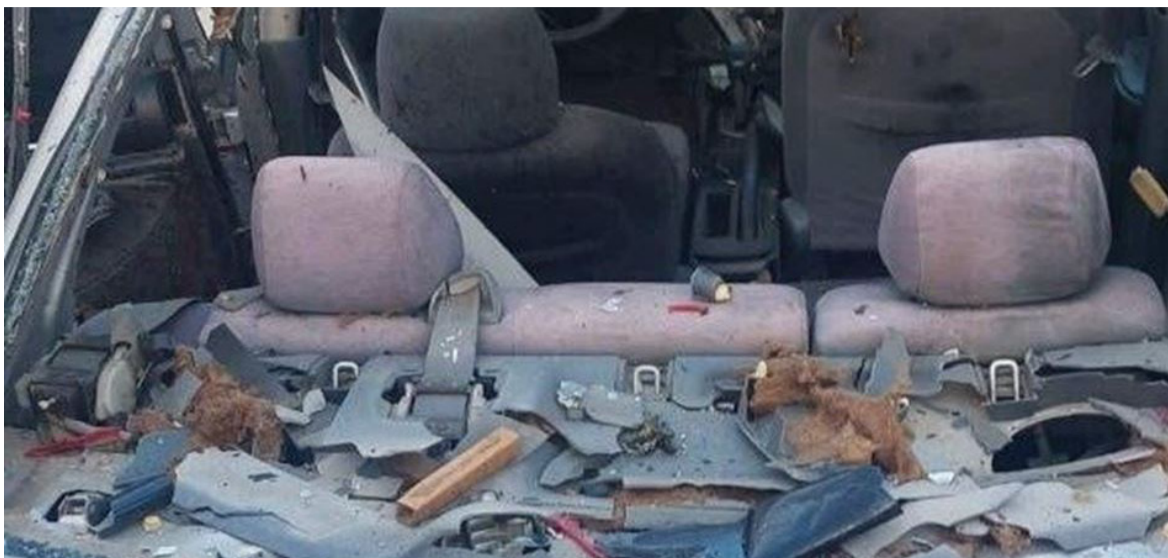
الانباط - وكالات

تعزيز منطقة جنين بمزيد من القوات خشية عمليات فدائية للمقاومة رداً على جرائم الاحتلال. الفصائل الفلسطينية وعلى رأسها حركة حماس أدانت عملية الاغتيال وأكدت أنها لن تمر دون عقاب. شاهد عيان من المنطقة قال لـ "المركز الفلسطيني للإعلام" الساعة ٤:٤٠ دقيقة صباحاً سمنا صوت إطلاق نار، وصعدت إلى سطح المنزل، وكان هناك باص أبيض فيه قوات خاصة تطلق النار على السيارة بكثافة، وبعد دقائق اقتحمت قوات كبيرة من الاحتلال وحاصرت المنطقة. وأضاف الشاهد أنه سمع دوي انفجار في المنطقة تبين لاحقاً أن الاحتلال فجر السيارة بعد أن تأكد أنه تم استشهاد المقاومين.