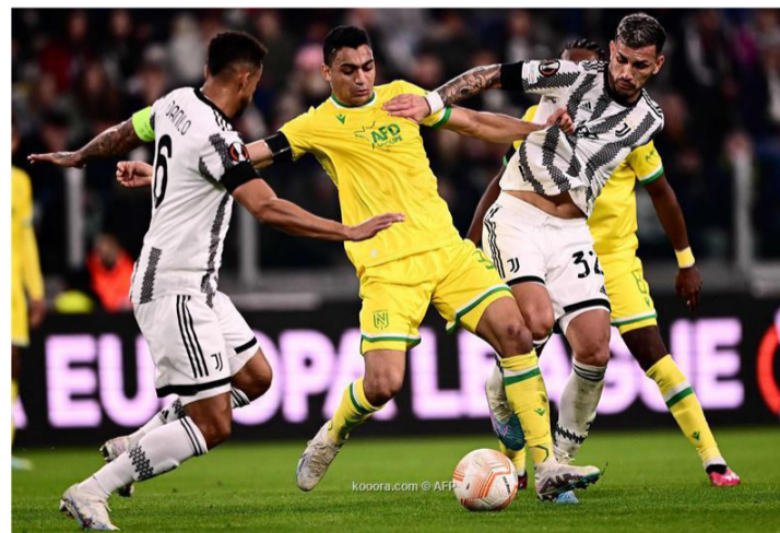
اسطنبول - وكالات

وأشار التقرير، إلى أن جالطة سراي يتنظر لنهاية الموسم للتعرف على الموقف الأخير بالنسبة لنادي نانت وحسم حاجته لمهاجم جديد. وأكد التقرير أن إعادة اللاعب ماورو إيكاردى من باريس سان جيرمان الفرنسي، تنتهي بنهاية الموسم الحالي وهناك عروض له للرحيل لأندية أخرى، كما أن عقد بافتيمبي جوميز قارب على الانتهاء وربما لا يتم تجديده مع تقدم عمره. ويواجه جالطة سراي معاناة في حسم صفقة المهاجم السويسري هاريس سيفروفيتش، الذي يلعب حالياً على سبيل الإعارة مع سيلتا فيجو الإسباني، قادماً من بنفيكا البرتغالي.