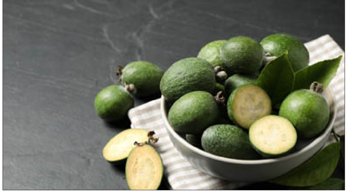
الانباط - وكالات

فاكهة الفيجوا، المعروفة أيضاً باسم جوافة الأناناس، هي فاكهة حلوة وعصارية ولذيذة، أصلها يعود لعقود في أمريكا الجنوبية، واليوم يتم استزراعها وتصديرها ل مختلف دول العالم.