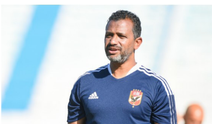
القاهرة - وكالات

النقاط مع المنافسين في المسابقة، وعدم السقوط في فخ الموسم الماضي، وواصل: "الآن مباراة صن داوتز هي الخطوة الأهم في المرحلة الحالية، لتحسين وضع الفريق في المجموعة، وتعزيز فرصه في الصعود. وأضاف: "إذا كان فريق صن داوتز مميزاً، وهو كذلك بالفعل، فالأهلي أيضاً يمتلك التاريخ والبطولات، وسيكون لقاء الفريقين متكافئاً، ومن يمتلك الرغبة الأقوى في الفوز هو الذي سيحسم المباراة. وشدد على أن لاعبي المراد الأحمر تعرضوا لجميع المواقف الصعبة، لاسيما الضغوط الجماهيرية للمنافسين، وأن حضور مشجعي صن داوتز في ملعب فوكتس بمدينة بريوتوريا "لا يشكل أي ضغوط على الأهلي".