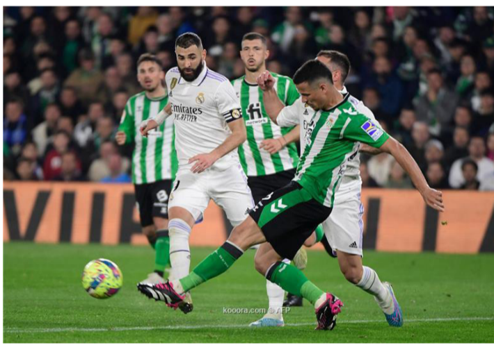
مدريد - وكالات

ليغزبول، سيكون مرهونا بمشاركته في مران الامس من ناحية أخرى، يواصل فيرلاندي ميندي تعافيه من إصابة عضلية بالفخذ الأيسر، وشارك الخميس في جزء من المران الجماعي، في حين تدرّب ديفيد ألّبا منفرداً، وأجرى بعض التدريبات بالكرة. ويحتل ريال مدريد وصافة جدول ترتيب الدوري الإسباني، برصيد ٥٣ نقطة، بفارق ٩ نقاط عن برشلونة المتصدر.