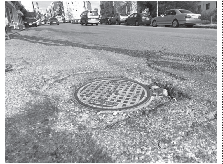
الأنباط - نزار البطيئة