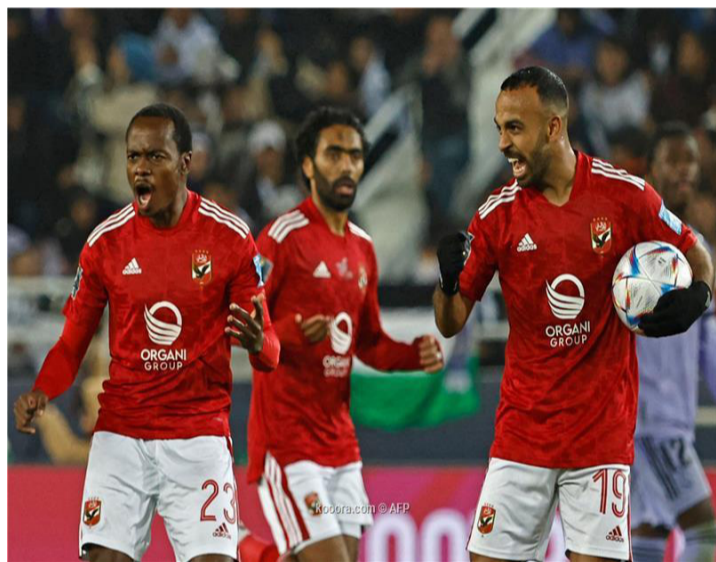
القاهرة - وكالات

”بيرنلي يلعب له الجنوب أفريقي ليلي فوستر وقد ينضم له بيرسي، خاصة أن كومباني يعرف تماماً قدرات تاو، وسبق أن دربه في أندراخت البلجيكي، وينتهي عقد بيرسي تاو صاحب الـ ٢٨ عاماً في صيف ٢٠٢٤ مع الأهلي بعدما انضم إليه قادماً من برايتون الإنجليزي. وتأتي تاو مؤخراً مع الأهلي في دوري أبطال أفريقيا وسجل هدفاً ضد صن داونز الجنوب أفريقي والقطن الكاميروني.