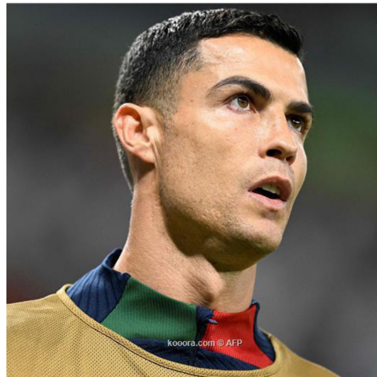
باريس - وكالات

ليونيل ميسي، يستطيع الوصول إلى رقم رونالدو في المستقبل القريب، حيث سجل حتى الآن ٩٨ هدفاً دولياً، فيما يحل الهندي سونيل شيتري المركز الثالث من بين الهادفين الحاليين برصيد ٨٤ هدفاً. على الصعيد الأوروبي، يتعد مهاجم المنتخب البولندي روبرت ليفاندوفسكي (٧٨ هدفاً) عن رقم رونالدو بفارق ٤٠ هدفاً. وفيما يلي قائمة أفضل الهادفين الدوليين في القارة الأوروبية: كريستيانو رونالدو (البرتغال): ١١٨ هدفاً في ١٩٦ مباراة. فيرينك بوشكاش (المجر وإسبانيا): ٨٤ في ٨٩ مباراة. روبرت ليفاندوفسكي (بولندا): ٧٨ في ١٣٨ مباراة. ساندر كوسيتش (المجر): ٧٥ في ٦٨ مباراة. ميروسلاف كلوزه (ألمانيا): ٧١ في ١٢٧ مباراة. جيرد مولر (ألمانيا الغربية): ٦٨ في ٦٢ مباراة. روبي كين (إيرلندا): ٦٨ في ١٤٦ مباراة. روميلو لوكاكو (بلجيكا): ٦٨ في ١٠٤ مباراة. إدين دجيكو (البوسنة والهرسك): ٦٤ في ١٢٦ مباراة. زلاتان إبراهيموفيتش (السويد): ٦٢ في ١٢١ مباراة. كيف جاءت أهداف رونالدو الدولي؟ ٥٦ هدفاً من أهداف رونالدو، جاءت في مباريات بيتية (بما في ذلك الأهداف الخمسة التي سجلها في كأس الأمم