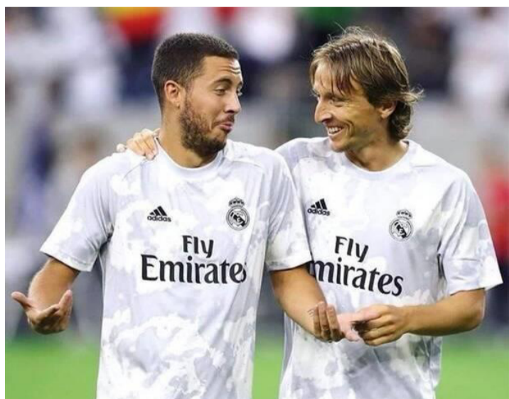
مدريد - وكالات

في السعودية، ولفت ”نسبة تواجد ميسي في الدوري السعودي تصل إلى ٥٠٪، اللاعب لا يريد العودة للبارسا وعلاقته سيئة برئيس النادي خوسيه مودريتش وإيدين هازارد من أقرب اللاعبين المتوقع رحيلهم للدوري السعودي. وقال دياز في تصريحات لبرنامج ملعب SBC السعودية ”مودريتش سيأتي إلى الدوري السعودي في صيف ٢٠٢٣ أو ٢٠٢٤، كونه يرغب في إنهاء مسيرته بالمملكة. وتابع: ”إذا حصل هازارد على عرض سعودي، ستتكفل إدارة ريال مدريد بحجز طائرة خاصة للنجم البلجيكي من أجل الرحيل، ونوه ”الشوك كبيرة حول تجديد عقد ميسي مع باريس، كون برشلونه دخل في مفاوضات مع اللاعب، كما أن والد اليرغوثي تواجد عن خدمات نيماز.