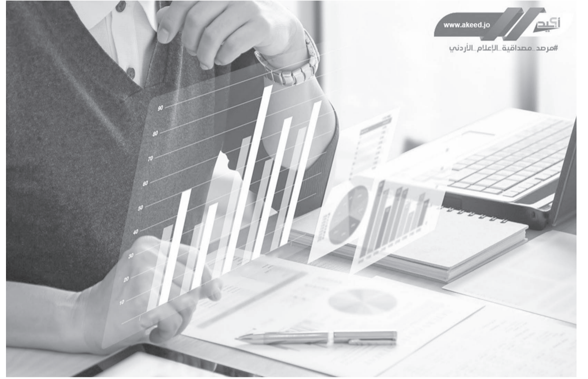
أكيمة #مرصد مصداقية الإعلام الأردني

إشاعات بنسبة بلغت ٢٠ بالمئة. وأشار المرصد إلى أن القاعدة الأساسية في التعامل مع المحتوى الذي يُنتجه مستخدمو مواقع التواصل الاجتماعي هي عدم إعادة النشر إلا في حال التحقق من مصدر موثوق، وإن الاعتماد على مستخدمي مواقع التواصل الاجتماعي كمصدر للأخبار دون الأخذ بالاعتبار دقة المحتوى من عدمه يتسبب بنشر الكثير من الأخبار غير الصحيحة والبعيدة عن الدقة، وبالتالي ترويج الإشاعات وانتشار المعلومات المضللة والخاطئة. واعتمد المرصد على تحديد الإشاعات الواضح بأنها غير صحيحة، أو تلك الأخبار التي ثبت عدم صحتها بعد نشرها خلال الأيام التي تلت النشر. وطوّر المرصد مجموعة من المبادئ الأساسية للتحقق من المحتوى الذي يُنتجه المستخدمون، بصرف النظر عن نوع المحتوى، إن كان مرئيًا أو مكتوبًا، أو مسموعًا أو مقروءًا، والتي توضح ضرورة طرح مجموعة من الأسئلة قبل اتخاذ قرار نشر المحتوى المنتج.