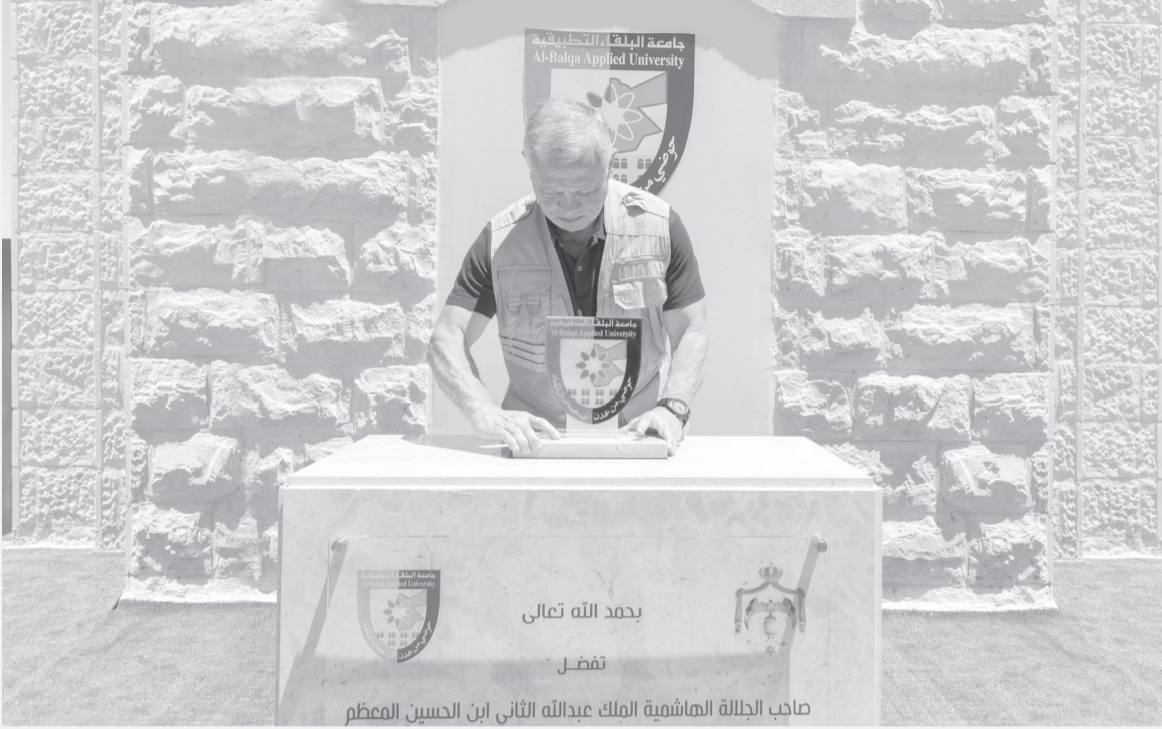
صاحب الجلالة الملك عبدالله الثاني ابن الحسين المعظم