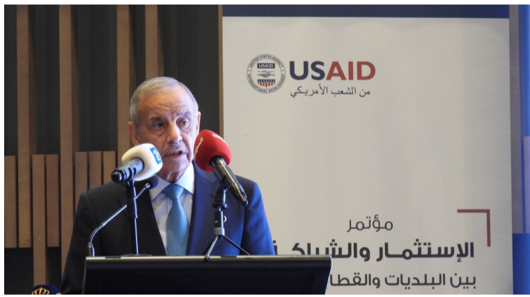
الانباط - العقبة

من جهة أخرى، مُعرباً عن تطلعه إلى ذلك اليوم الذي يرى فيه مشاريع تنموية ابتكارية وريادية في جميع بلديات المملكة، والتي ستعمل على توليد فرص عمل للشباب والمرأة والأشخاص ذوي الإعاقة.