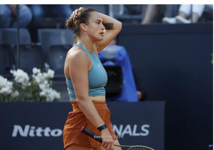
روما - وكالات

ودعت اليلاروسية أرينا سابالينكا، منافسات بطولة روما للتنس، بعد الخسارة بمجموعتين دون رد أمام الأمريكية صوفيا كينين. وخسرت سابالينكا بنتيجة ٦-٧ (٤-٧) و٦-٦ أمام صوفيا كينين التي ستواجه الأوكرانية أنهلينكا كالينينا في الدور المقبل. ولم