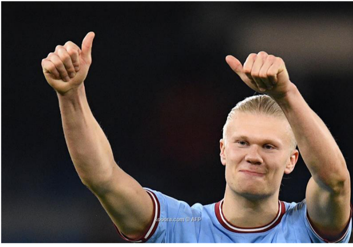
لندن - وكالات

تم اختيار إيرلينج هالاند مهاجم مانشستر سيتي، كأفضل لاعب في موسم كرة القدم الإنجليزية، برأي رابطة كتاب كرة القدم الإنجليزية FWA. وقدم هالاند موسماً رائعاً حيث بلغ عدد أهدافه في جميع المسابقات حالياً ٥١، وفاز بنسبة ٨٢ في المائة من تصويت رابطة FWA، وهو أكبر هامش انتصار منذ بدء الدوري الإنجليزي الممتاز. وأنهى بوكايو ساكا جناح أرسنال السباق في المركز الثاني، بينما حل زميله في فريق أرسنال مارتن أوديجارد في المركز الثالث. واحتل كيفن دي بروين لاعب مانشستر سيتي المركز الرابع، فيما جاء ماركوس راضفورد مهاجم مانشستر يونايتد بالمركز الخامس. وأصبح اللاعب النرويجي البالغ من العمر ٢٢ عاماً، أول لاعب في مانشستر سيتي يفوز بجائزة لاعب الموسم برأي الكتاب، والتي يتم تقديمها منذ العام ١٩٤٨، منذ أن نالها قلب الدفاع روبن دياز عن الموسم ٢٠٢٠-٢٠٢١ من ناحية ثانية، أصبحت سام كير مهاجمة تشيلسي، أول لاعبة تفوز بجائزة أفضل لاعبة في الموسم برأي الكتاب مرتين متتاليتين. وحصلت اللاعبة الأسترالية على ضعف عدد الأصوات التي نالها راشيل دالي نجمة إنجلترا وأستون فيلا، بينما حصلت لاعبة تشيلسي لورين جيمس