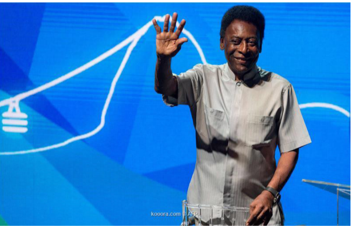
البرازيل - وكالات

يستقبل الضريح المهدون فيه بيليه، لاعب الكرة البرازيلي السابق بيليه، والذي توفي في ٢٩ ديسمبر/ كانون أول الماضي عن عمر ٨٢ عاماً، في استقبال زيارات الجمهور بدءاً من يوم الإثنين المقبل، حسبما أعلنت الجمعة الجهات المسؤولة. ويرقد جثمان أسطورة كرة القدم البرازيلية بمقبرة Necropole Ecumênica، وهي مقبرة عمودية تعتبر الأطول في العالم، وتضيه الشقق الشاطئية، وتقع في مدينة سانتوس، حيث أمضى أغلبية مسيرته الاحترافية الناجحة.