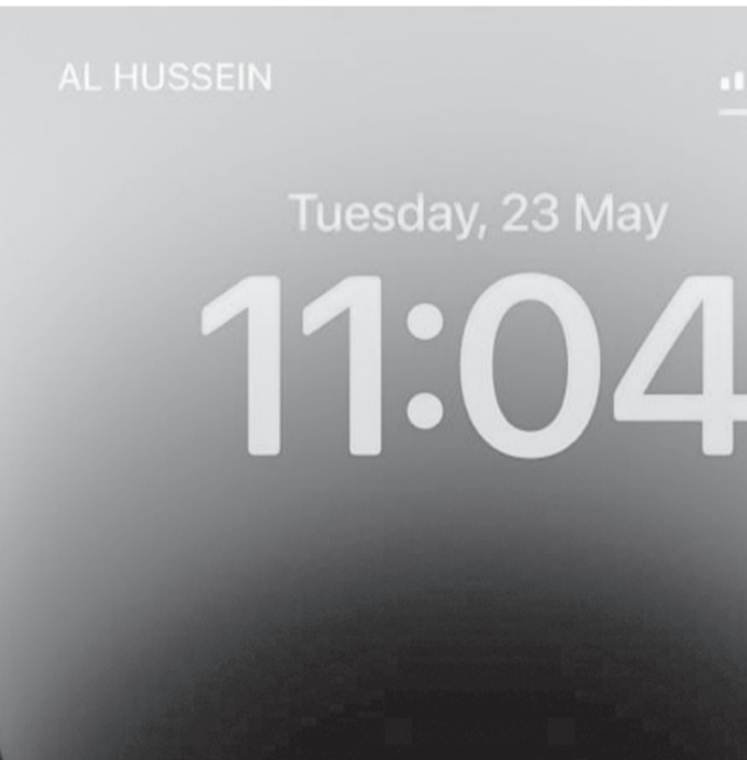
الانباط - عمان

السعيدة. وجاءت هذه الخطوة من قبل زين في إطار حرصها الدائم على الاحتفال بكافة المناسبات وأيام الفرح الأردنية، لمشاركة الأردنيين أفراحهم، وكانت الشركة قد أطلقت في وقت سابق أغنية بعنوان "هذا يوم الفرح" بصوت الفنان حسين السلطان ضمن احتفالاتها بهذه المناسبة، فيما تستعد لإقامة احتفال ضخم في الأول من حزيران.