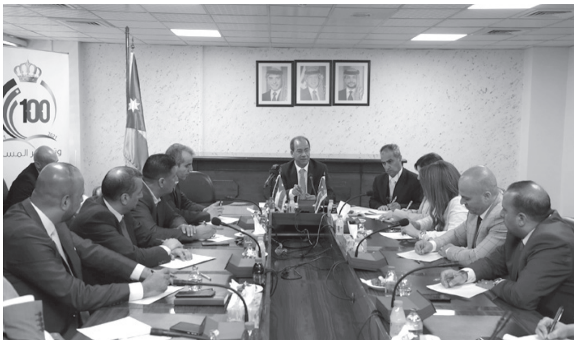
نبض البلد- عمان

الناطقين الإعلاميين، سيجري عقد اللقاءات الدورية بين وزير الاتصال الحكومي والناطقين في مقر الوزارات تبعاً. وأشار إلى أن مسودة السياسة العامة للإعلام تضمنت بناء علاقة الثقة مع الجمهور ووسائل الإعلام، حيث يتأتى ذلك من خلال أدوات منها تفعيل قنوات الاتصال وبناء الثقة مع الجمهور ووسائل الإعلام وتمكين الناطقين الإعلاميين، وذلك من خلال تحضير الرسائل الإعلامية للوزارات والمؤسسات الحكومية لدعم استراتيجياتهم وخططهم، بما يهدف إلى توحيد الرواية الحكومية. كما أكد الشبول في هذا الإطار، ضرورة وضع آلية واضحة للناطقين الإعلاميين باسم الوزارات والمؤسسات الحكومية للرد على الاستفسارات الإعلامية بالتعاون مع وزارة الاتصال الحكومي، بهدف ضمان تدفق المعلومات وسرعة انسيابها إلى وسائل الإعلام والجمهور، بما يساهم في توحيد