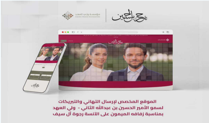
الموقع المخصص لإرسال التهاني والتبريكات لسمو الأمير الحسين بن عبدالله الثاني - ولي العهد بمناسبة زفافه اليمون على الأنسة رجوة آل سيف