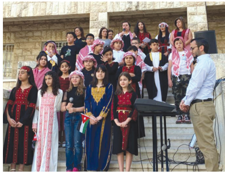
واناشيد وهفاند) ، بالإضافة إلى مباريات قدم ودية بين الطلاب ، ومباراة كرة سلة بين المعلمين والطلاب.