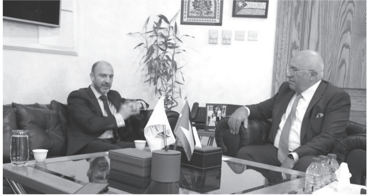
الانباط - عمان بحث رئيس مجلس مفوضي الهيئة المستقلة للانتخاب المهندس موسى المعايطة، خلال لقائه في مكتبه امس الثلاثاء، السفير البلجيكي في عمان

بدوره، أبدى السفير البلجيكي استعداد بلاده بالتعاون مع الهيئة، بما يخدم مسيرة الإصلاح الديمقراطي في الأردن، ويسهم في تجويد العملية الانتخابية بمراحلها المختلفة، مشيداً بجهود الهيئة في مجال التوعية والتثقيف السياسي وافتتاحها على شركاء العملية الانتخابية.