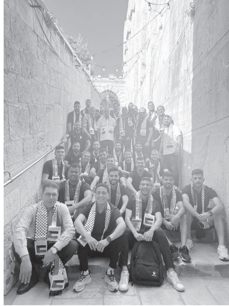
وفد اتحاد الاعلام الرياضي