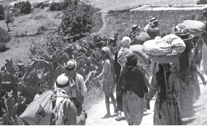
الانباط-وكالات المعاصرة، لتكون قريبة من حياة من يشاهدونها.

افتتح في البلدة القديمة برام الله، المعرض الأول من نوعه لفن الكوميكس "أو القصة القصيرة الصورة"، بمشاركة أكثر من 20 فنانا فلسطينيا وعالميا. ويقدم المعرض رسومات متنوعة حسب خلفية الفنان وتجاريه، لكنها حملت في مضامينها توثيقا لرواية الفلسطينية للحفاظ عليها من الاندثار، إلى جانب معالجة ظواهر اجتماعية مختلفة من خلال هذا الفن العالمي، الذي يعود تاريخه إلى عشرات السنين. وحتى لا تبقى الذاكرة الفلسطينية معلقة في عقول كبار السن، ومخافة أن تسقط بالتقدم، وحتى تمرر الرواية لكل الأجيال، أقيم المعرض في رام الله. كما تناولت الظواهر الاجتماعية