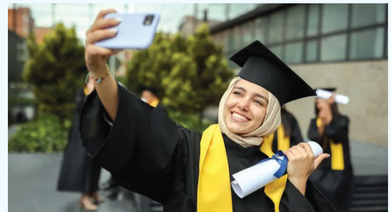
منح الحكومة التركية

منحة المعهد العربي الأمريكي؛ ينهي على المتقدم لمنحة أن يكون حاصلًا على الإقامة القانونية الدائمة في أميركا، وأن يكون مسجلاً حالياً في جامعة، أو في السنة الأخيرة من المرحلة الثانوية. ويملك تسجيل بياناتك على موقع المؤسسة لاستلام إشعار بفتح طلبات التقديم لعام المقبل. منحة اللجنة الأميركية العربية لمكافحة التمييز؛ تقدم اللجنة منحة للطلبة من أصول عربية، ممن يخططون للدراسة في مجال الصحافة والإعلام والسياسة والاقتصاد، مرحلة البكالوريوس والدراسات العليا. ويمكن التقدم للمنحة على موقع اللجنة.