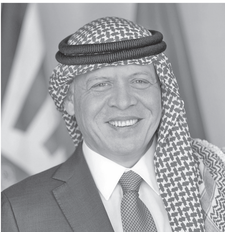
أرض الوطن، امس الأحد، بعد زيارة خاصة. الانباط - عمان عاد جلالة الملك عبدالله الثاني إلى