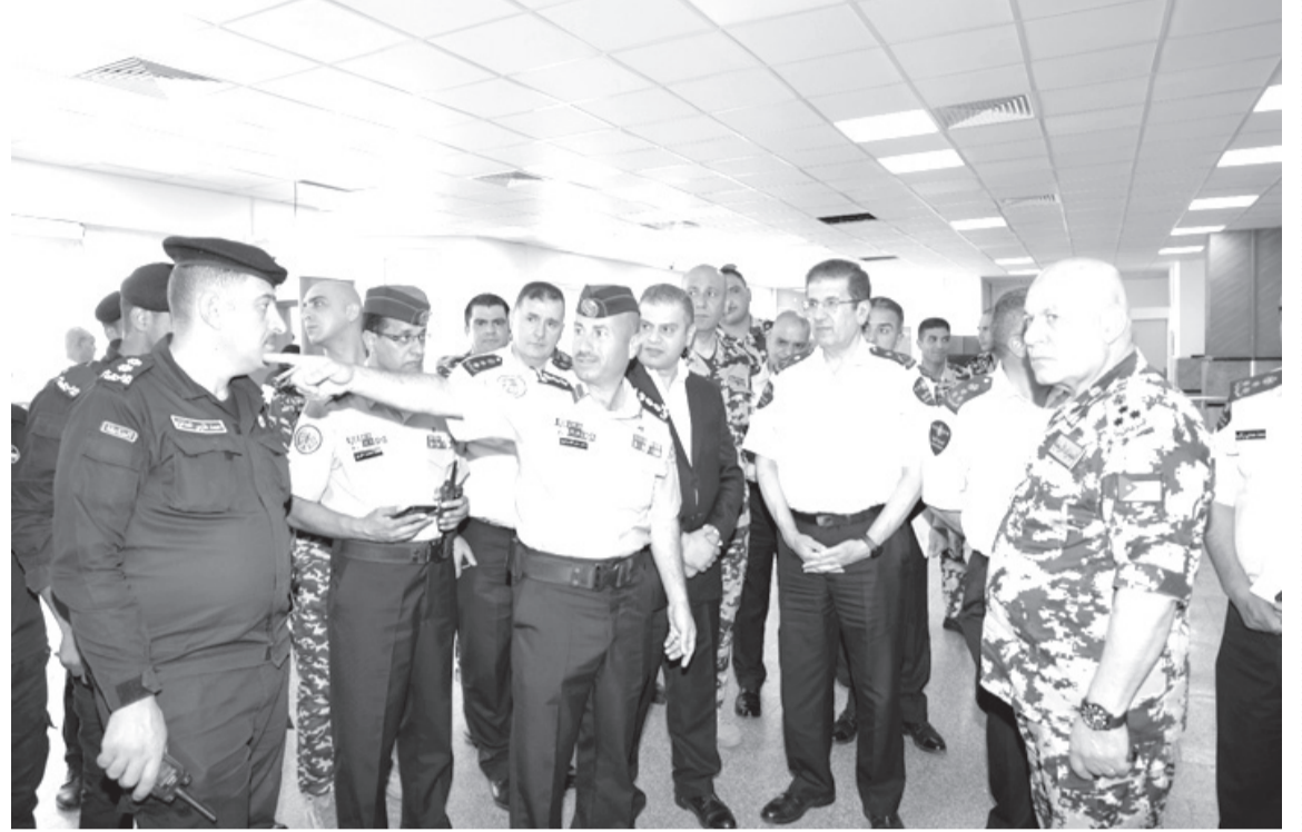
الابتاط-عمان جمارك المهندس جلال القضاة مركز جمرك حدود العمري واطلع على سير العمل والخدمات المقدمة للمسافرين في جولة تفقد مدير عام الجمارك الأردنية لواء

وقال الشولون أنه تم التعامل مع 44 ألف مسافر قادمين عبر المركز على متن 11 ألف مركبة خلال يومين فقط فيما بلغ عدد القادمين من خلال المركز 169 ألف مسافر على متن 19 ألف مركبة خلال الأسبوع الأخير. وأضاف الشولون أنه تم تطبيق خطة الطوارئ تزامناً مع انتهاء دوام المدارس في دول الخليج وقرب حلول عيد الأضحى المبارك وتم التعامل مع كافة الأعداد القادمة وقدمت لهم كافة الخدمات الجمركية والإنسانية بالتعاون والتنسيق التام مع الجهات والأجهزة الأمنية العاملة في المركز. وأشار الشولون إلى مضاعفة أعداد الكوادر التي تقدم الخدمة من خلال زيادة ساعات العمل لشتت الواحد ودمج عمل الشفتات حتى تعمل بكامل طاقتها لخدمة الأخوة المواطنين ورعايا الدول المجاورة وتم إنجاز خدمة هذا العدد الكبير بفترة زمنية قياسية.