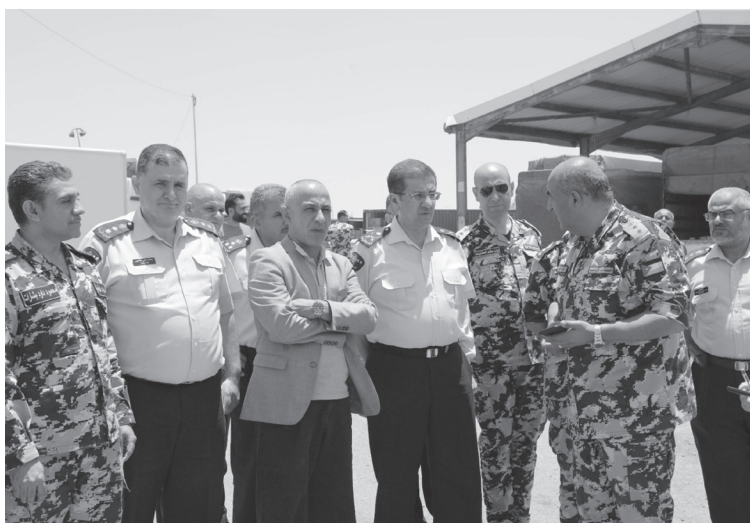
نقل الخبرات بين الموظفين من خلال الدورات التدريبية

واجتمع القضاة، خلال الزيارة بإدارة وموظفي المركز مؤكداً على ضرورة بذل أقصى الجهود والطاقت والعمل بروح الفريق الواحد والتعاون مع الجهات المختلفة العاملة في المركز، وأهمية