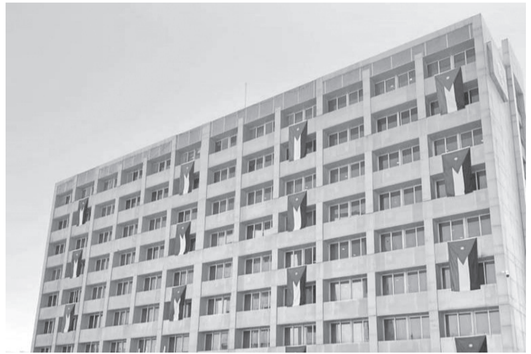
الأنباط- عمان منح الاتحاد العالمي للأعمال، شركة مناجم الفوسفات الأردنية، جائزة التميز في الأعمال، من بين 3000 جهة، تمثل 130 دولة حول العالم.

وحصلت الشركة على الجائزة، بعد أن حققت المعايير المحددة للجائزة في مجالات الريادة في الأعمال، ونوعية المنتجات، وأنظمة الإدارة، والابتكار والإبداع، والمسؤولية الاجتماعية و النتائج المحققة.