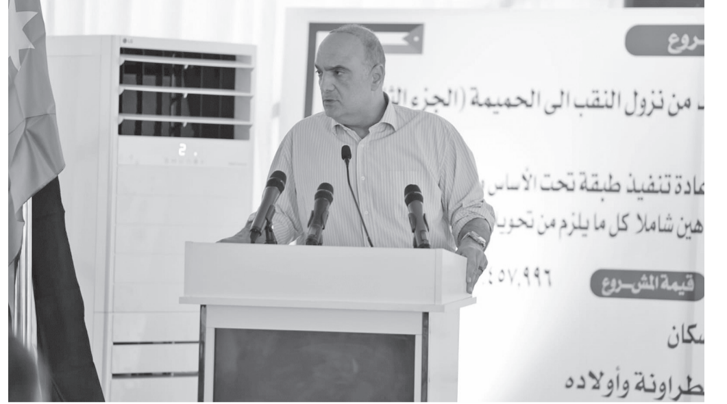
الانباط - العقبة