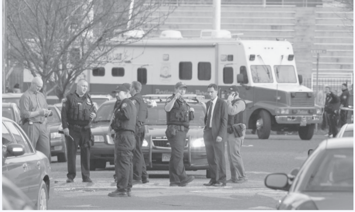
وقال فوكس: "أعدنا أن نسجل ١٢ أو ١٣ حادثاً في السنة. لكن ٢٨ حادثاً في نصف عام رقم مذهل.."

شهدت الولايات المتحدة هذا العام أشد ستة أشهر دموية من حوادث القتل الجماعي منذ عام ٢٠٠٦؛ إذ تتراوح هذه الحوادث بين القتل بأيدي الغرباء أو المقربين ومذابح في بلدات صغيرة، وفي مدن كبرى، داخل المنازل أو خارجها في وضوح النهار، بحسب تقرير لصحيفة The Guardian البريطانية، الجمعة ١٤ يوليو/تموز ٢٠٢٣. التقرير أشار إلى أنه في الفترة من ١ يناير/كانون الثاني إلى ٣٠ يونيو/حزيران، شهدت البلاد ٢٨ حادثة قتل جماعي، جميعها باستثناء واحدة استخدمت فيها أسلحة نارية، وكان عدد القتلى يرتفع كل أسبوع تقريباً، في حلقة مستمرة من العنف والحزن. ويُعرف القتل الجماعي، بأنه حادث يُقتل فيه أربعة أشخاص أو أكثر ليس من ضمنهم المعتدي، في ظرف ٢٤ ساعة، وتتعقب قاعدة بيانات تحفظ بها وكالة أسوشيتد برس وصحيفة USA Today بالشراكة مع جامعة نورث إيسترن هذا العنف واسع النطاق منذ عام ٢٠٠٦.