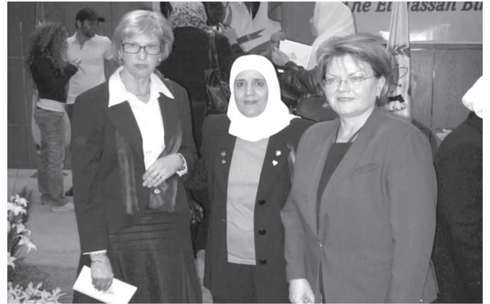
الانباط - رامز ابو يوسف

خلال المائة عام الماضية، وأحتلت الأردنية الأستاذة الدكتورة جهاد عمر الحلبي المرتبة الأولى على السويد. وذكرت منظمة سيفغا أوميفا تاو السويدية على صفحتها في موقعها الإلكتروني الرسمي أن الأستاذة الدكتورة جهاد عمر الحلبي واحدة من مائة شخصية تمريضية كانت الأكثر تأثيراً في الحقل التمريضي خلال المائة عام الماضية في أوروبا فيما يخص التعليم والبحث العلمي وخدمة المجتمع والإدارة والممارسة العملية. وأضافت أن إسهاماتها في المجال التمريضي الأكاديمي والميداني تعدت وطنها الأم (الأردن) لتترك بصمات مشرفة في العديد من دول العالم كأمريكا وكندا وأوروبا والسودان واليمن والإمارات العربية المتحدة وقطر والسعودية وسوريا والعراق وغيرها