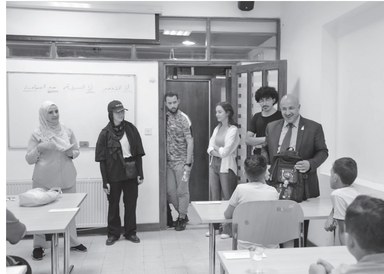
الجال أمام الطلبة المشاركين للاستفادة من العطلة المدرسية، بالتعويض

يذكر أن الجامعة وانطلاقاً من دورها في تنمية المجتمع وخدمته، ستطلق الشهر الحالي جامعة الأطفال المؤلفة من ثلاثة برامج رئيسية هي: مبادرة حرك تعلم والبروفيسور الصغير ومخيم الابتكار، بالتعاون مع جمعية ابتكار للتنمية والإبداع.