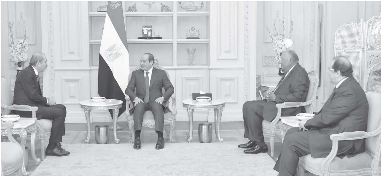
الأبواب - العليين

كما جرى بحث القضية الفلسطينية وجهود تفعيل العملية السلمية في سياق التنسيق المستمر بين البلدين الشقيقين، وتأكيد أهمية مواصلة العمل على تكثيف الجهود الدولية المستهدفة تحقيق السلام العادل والشامل على أساس حل الدولتين، ووفق المرجعيات المعتمدة وقرارات الشرعية الدولية.