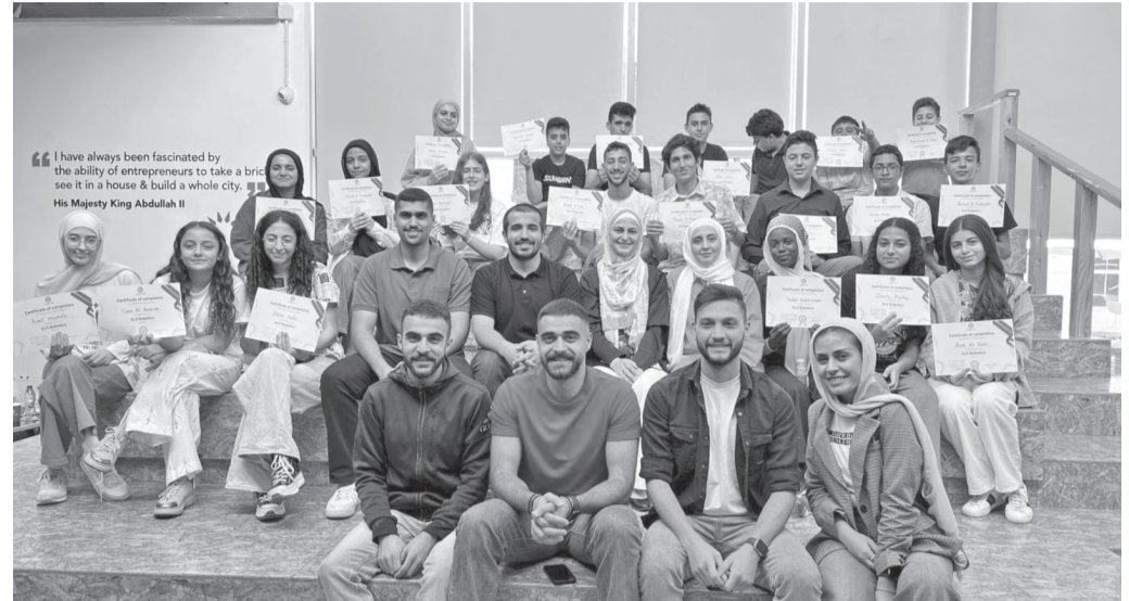
الإنباط - عمان

اختتمت منصة زين للإبداع (ZINC) برنامجاً مجتمع الرياديين الصغار الأردني (YESJO)، الذي كان قد بدأته خلال فترة العطلة الصيفية للمدارس، والذي يهدف إلى تنمية مهارات الطلاب المشاركين من عدة مدارس حكومية وخاصة ضمن الفئة العمرية (١٢-١٦) عاماً، واكتشاف مواهبهم وميولهم وتعزيز مفهوم ثقافة ريادة الأعمال فيما بينهم، لينضجوا إلى الجيل القادم من رواد الأعمال، وللمساهمة في تحسين فرصهم في المستقبل. وأقامت المنصة حفلات التخرج لطلبة المشاركين في البرنامج في شمال ووسط وجنوب المملكة، وذلك في فروع المنصة في مجمع الملك الحسين للأعمال، وجامعة اليرموك، وجامعة مؤتة، حيث قدم الطلاب المشاركون إيجازاً وعرضاً تقديمياً عن مواضيع الدورات