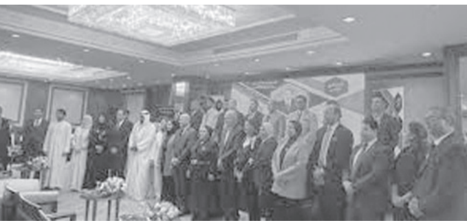
الأبواب - عمان

توفير الدعم لذلك من خلال الجامعة العربية، والاهتمام بالرقمنة وتوفير استراتيجية عربية تعنى بالعمل والشباب، وعرض الكريمن الاهتمام بالأممية العمل لمواجهة التحديات الاقتصادية مجلس الشباب العربي للتنمية المتكاملة، وذلك في إطار مبادرة الرئيس المصري عبدالفتاح السيسي بتخصيص عام ٢٠٢٣ "عاما للشباب العربي".