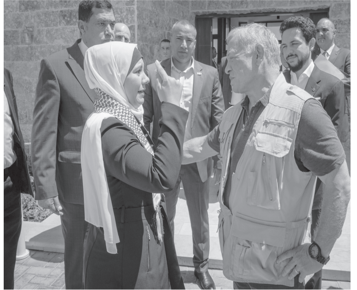
الأبواب - عجلون

مبينة أن مسار التليفريك يمتد على ٢ كم ويشمل ٤٠ كابينة بسعة ٨ أشخاص للكابينة الواحدة وتبلغ مدة الرحلة في الاتجاه الواحد حوالي ١٠ دقائق.