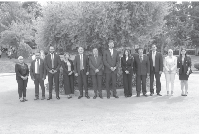
الأبناط - عمان

تعليمية ريادية ذات موارد وفرض متميزة في الجانبين الأكاديمي والمهني لرفد السوق العالي بكفاءات وخبرات مؤهلة بالتطورات التكنولوجية والعلمية التي يشهدها العالم. من جانبه، أشاد البيطخي بالجهود المبذولة من قبل الجامعة في تطوير التعليم وتمكين الشباب من تحقيق طموحاتهم الأكاديمية والمهنية، معرباً عن تفاؤله بأن يكون هذا التعاون نقطة تحول إيجابية في حياة الطلبة وتحقيق أحلامهم، وذلك كجزء من مساهمة البنك في التنمية المستدامة وخدمة المجتمع، ودعم قطاع التعليم والمساهمة في رفد السوق بالقوى العاملة المؤهلة والتميزة.