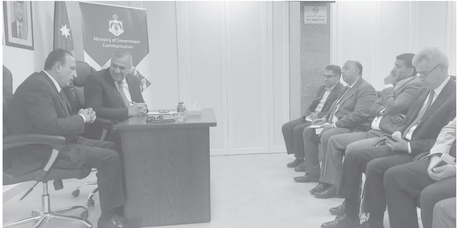
الأبناط - عمان

عقدت وزارة الاتصال الحكومية أمس الأربعاء محاضرة توعوية بعنوان "معايير النزاهة الوطنية" ألقاها مدير مديرية النزاهة والوقاية في هيئة النزاهة ومكافحة الفساد الدكتور عاصم الجدوع. وأكد أمين عام الوزارة الدكتور زيد النوايسة خلال كلمة في المحاضرة، أهمية دور الإعلام في التوعية والتثقيف حول تطبيق معايير النزاهة الوطنية.