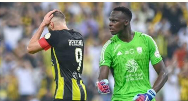
الرياض - وكالات

للأمام في هذا البلد، وتابع: "إضافة إلى ذلك، السعودية دولة إسلامية رحبت بي بأذرع مفتوحة، وشعرت بالحب على الضور، وكمسلم، عندما تتواجد في مكة تشعر بالسلام، هذا مكان استثنائي.. وواصل: "يوجد هنا الكثير من الشغف، أنا سعيد بمستوى اللعبة، أنا مندهش من المستوى في السعودية، ففي أوروبا لم تكن تشهد الكثير من المباريات التي تلعب بالملكة، ولكن الأمر يحدث الآن. يذكر أن بنزيم سجل ٣ أهداف رفقة الاتحاد في ٧ مباريات خاضها في الدوري وصنع هدفين آخرين.