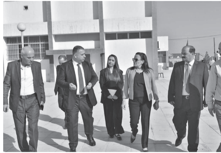
على الخدمات التدريبية المميزة التي تقدمها الأكاديمية الأردنية للسياحة والفندقة، ومشاعل الفندقية والمشاغل المتخصصة بالخياض. وأكدت الروابدة حرص المؤسسة على تعزيز الشراكة الحقيقية مع جميع