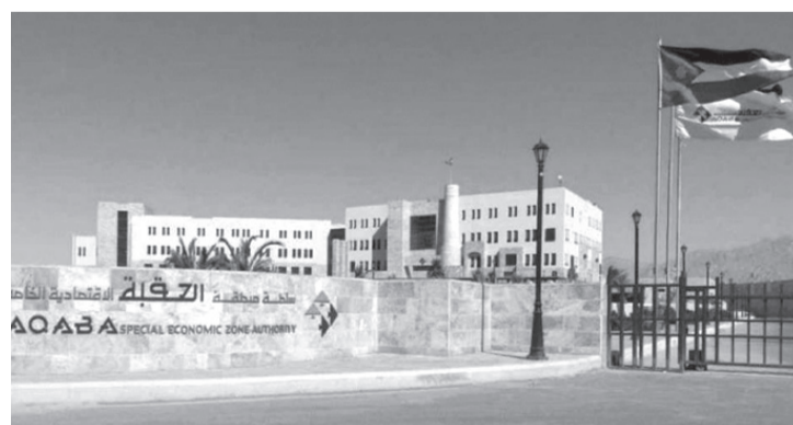
الأبناط - العقبة