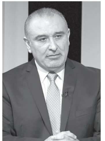
الأبناط - عمان

قال نائب رئيس الوزراء للشؤون الاقتصادية وزير الدولة لتحديد القطاع العام ناصر الشريدة، إن النظرة الاستراتيجية لجلالة الملك عبدالله الثاني، جعلت الأردن في