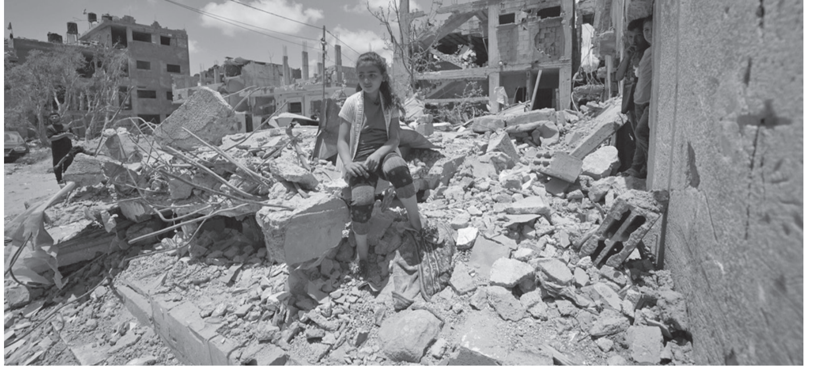
الأنباط - مرح الترك

الخوف غير المبرر، حيث يمكن أن تكون هذه علامات على تأثرهم بالأحداث من حولهم. من جانبه أكد الخبير في علم الاجتماع الدكتور علي الخضور لـ "الأنباط" على وحدة الدولة الأردنية والفلسطينية من جميع الجوانب، مشيراً إلى أنهما كأخوة بالدم، وأي خلل يحدث في فلسطين ينعكس بشكل كامل على الأردن، ويتسبب في خسائر تولد شعوراً بالاحباط واليأس لدى المشاهدين، ويمكن أن يؤدي إلى حالات من العدوانية والغضب الداخلي تجاه الأحداث.