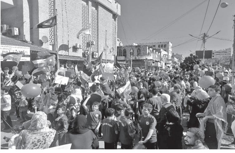
الأنباط - إربد

وألقى عدد كبير من الأطفال المشاركين كلمات وقصائد باللغتين العربية والإنجليزية، عبروا خلالها عن مشاعرهم المليئة بالهراء والصدق تجاه أطفال فلسطين الأيدي الغادرة في غزة، وأملهم في وقف فوري للحرب وأن يعيش أطفال غزة بسلام يمنحهم الفرح والحب وحق اللعب. من جهته، قال رئيس البلدية الدكتور نبيل الكوفحي، أن الدعوة لهذه الوقفة جاءت لترسيخ حب فلسطين في نفوس الأطفال الذين سيحملون الراية في مستقبل الأيام، ولتوعيتهم أن فلسطين هي القضية المحورية لجميع العرب والمسلمين. وأضاف الكوفحي، أن البلدية تعبر عن ضمير المواطنين وتوجهاتهم، وأنها حملت على عاتقها منذ تولي المجلس البلدي أعماله التفاعل مع جميع القضايا المجتمعية وعملت على إبراز دور التنمية والشراكة مع جميع المؤسسات، مشيراً إلى أن البلدية مستمرة في إقامة الفعاليات المناصرة لصدود الأهل في غزة.