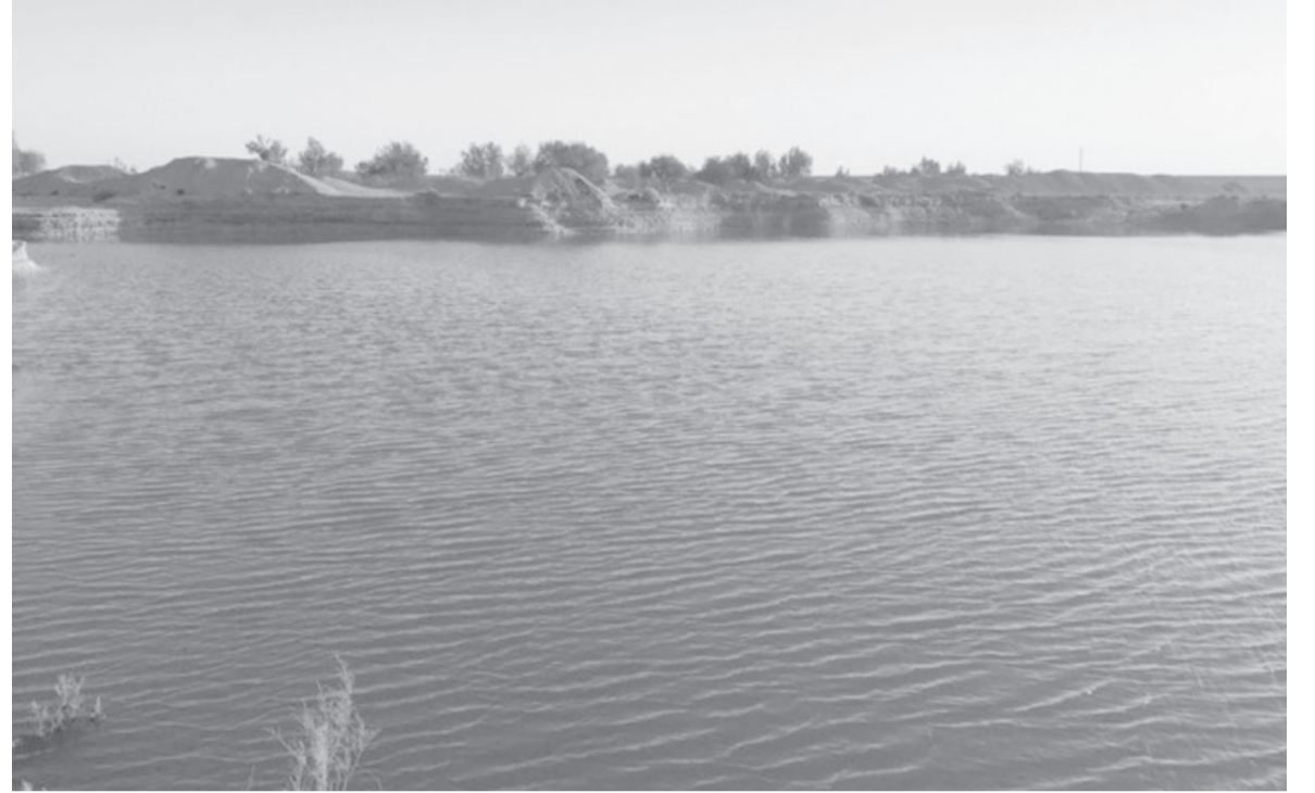
الأنباط - مينا بنيا ياسين

من الجدير ذكره أن الملك عبدالله الثاني مهتم جداً بتنفيذ سير العمل في تنفيذ الخطة الوطنية للزراعة المستدامة للأعوام (٢٠٢٢ - ٢٠٢٥)، مؤكداً ضرورة أن تساهم مشاريع الخطة الوطنية للزراعة في تعزيز الأمن الغذائي بالمملكة، والعمل على إزالة جميع العقبات التي قد تعترض تنفيذ المشاريع المدرجة ضمن الخطة، خاصة فيما يتعلق بتسويق فيما يتعلق بتسويق الصادرات الزراعية، مشدداً على أهمية دور مجلس الأمن الغذائي في دعم القطاع الزراعي.