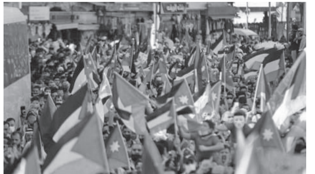
الانباط - غيذاء الخالدي

نستطيع لنصره الشعب الفلسطيني وبين ان جلالته الملك له رؤية ثاقبة وعلاقته مع الدول العالمية لها محل اعتبار ، ولطالما حذر "إسرائيل" من عدم المضي قدما في امتهان حرمة المسجد الأقصى والتهدئة في فلسطين للحفاظ على ارواح المدنيين الابرياء،