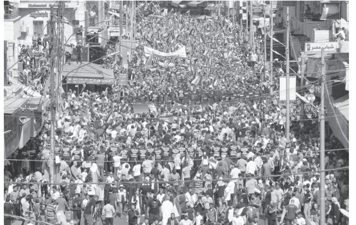
الأنياب - نعمت الخورة

ويحمل على كاهله همها، ليس بمنأى عن ما يحدث في قطاع غزة، وكان الأبرز من بين الأنظمة العربية والإسلامية كافة في نوعية وطبيعة وجرأة المواقف التي اتخذها ضد الكيان الصهيوني المحتل، والتي كان آخرها ما صرح به رئيس الوزراء الدكتور بشر الخصاونة حين قال: "أن كل الخيارات متاحة ومفتوحة امامنا"، وأتبع تصريحاته بـ "أن أي حالة تهجير لـ أهلنا في الضفة أو حتى غزة يعتبر إعلان حرب بـ النسبة لـ الأردن، وتبعه أول من أمس توجيه من رئيس مجلس النواب أحمد الصفدي لـ اللجنة القانونية في مجلس النواب ضرورة إعادة النظر في "الاتفاقيات الموقعة مع الكيان الصهيوني كافة"،