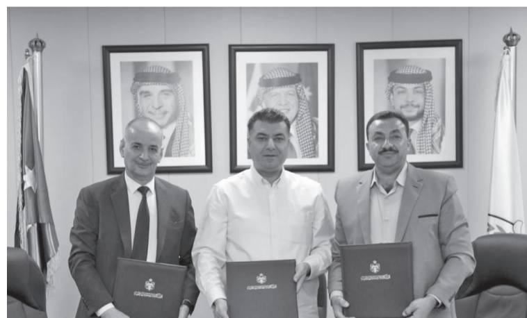
التزام التحالفات بتطبيق بنود الاتفاقيات التي وقعتها مع وزارة الزراعة.