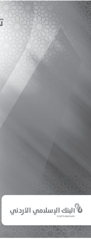
البنك الإسلامي الأردني

الاحتياجات الخاصة وشؤون القرآن الكريم. ويوضح التقرير نهج البنك في التنوع والمساواة، والتفاعل مع موردَي البنك، والمنتجات والخدمات التي يقدمها لعملائه، وتميز الشراكة مع العديد من الجهات والمؤسسات من أجل زيادة تأثير البنك المجتمعي، وتطبيق الحوكمة المؤسسية وإدارة المخاطر، والانتشار الجغرافي وأماكن التواجد، ورضا المتعاملين وأصحاب المصلحة، وتأثير البنك المباشر وغير المباشر على الاقتصاد الوطني، والامتثال للمتطلبات الرقابية والقانونية ومكافحة الفساد، وواجبات البنك اتجاه الموظفين والعاملين لديه وتطوير مهاراتهم من خلال توفير التدريب اللازم وتهيئة تكافؤ الفرص لهم وتطوير وسائل الصحة والسلامة المهنية.