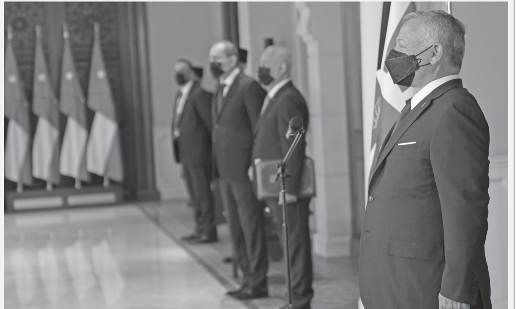
الأنباط- عمان جرت في قصر بسمان الزاهر، أمس الأحد، مراسم تقبل أوراق اعتماد عدد من سفراء الدول الشقيقة والصديقة المبعين لدى البلاط الملكي الهاشمي.

وقام السفراء بوضع أكاليل الزهور على أضرحة المغفور لهم؛ بإذن الله، جلاله الملك الباني الحسين بن طلال، وجلالة الملك المؤسس عبدالله بن الحسين، وجلالة الملك طلال بن عبدالله، طيب الله ثراهم. وحضر مراسم تقبل أوراق الاعتماد رئيس الديوان الملكي الهاشمي يوسف حسن العيسوي، ونائب رئيس الوزراء ووزير الخارجية وشؤون المغتربين أيمن الصفدي.