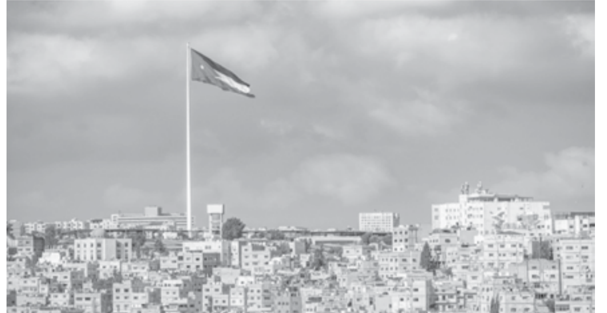
الأنباط - خليل النظامي

● مصادر متطابقة : المقاطعة تلحق خسائر فادحة بالمنتجات الأمريكية في السوق الأردني