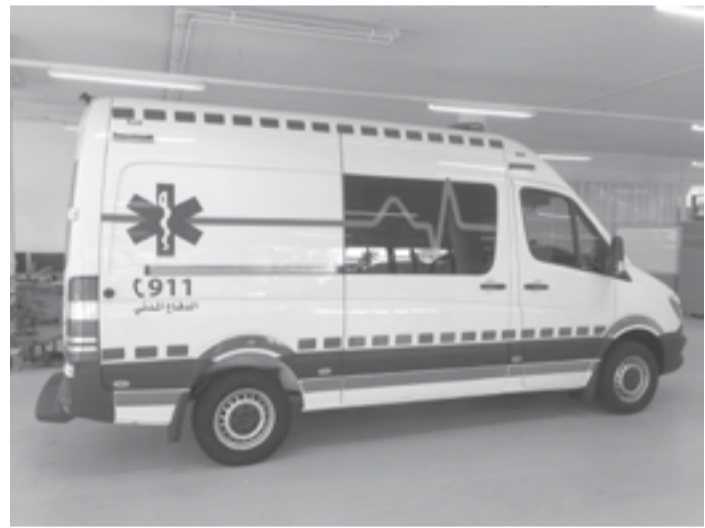
الأنباط - الكرك

بمنطقة المزار الجنوبي. وأكد أن طواقم الأطفاء عملت على إخماد الحريق وإقاذ خمسة مصابين حاصرتهم النيران وأخلاء ثلاث فرق الإسعاف على تقديم الإسعافات الأولية اللازمة للمصابين ونقلهم إلى المستشفى، لتلقي باقي الإجراءات الطبية اللازمة، هذا وسيتم فتح تحقيق بالأسباب التي أدت لنشوب الحريق.