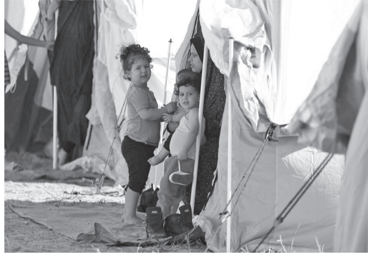
وتواصل القصف الإسرائيلي لليوم ٦٦ من العدوان على غزة في مناطق غزة تواجه الإبادة

قالت المدير العام لمنظمة أطباء بلا حدود، ميني نيكولاي، إن الوضع في غزة لا يمكن أن يستمر ويجب تنفيذ وقف إطلاق النار. وأشارت إلى أن الحصار يجب أن ينتهي ويفتح معبر شان لتسهيل إيصال المساعدات الإنسانية الحيوية، مشيرة إلى أن هذه المذبحة يجب أن تنتهي وأوضحت نيكولاي، أن الأطفال في غزة دون سن الخامسة عبروا عن رغبتهم بتفضيل الموت على الحياة تحت الحرب وحذرت مديرة أطباء بلا حدود من الوضع الكارثي في المستشفيات، مؤكدة أن عددا كبيرا من المرضى والمصابين يموتون في المستشفيات، كما شددت على خطورة انتشار الأمراض المعدية في القطاع.