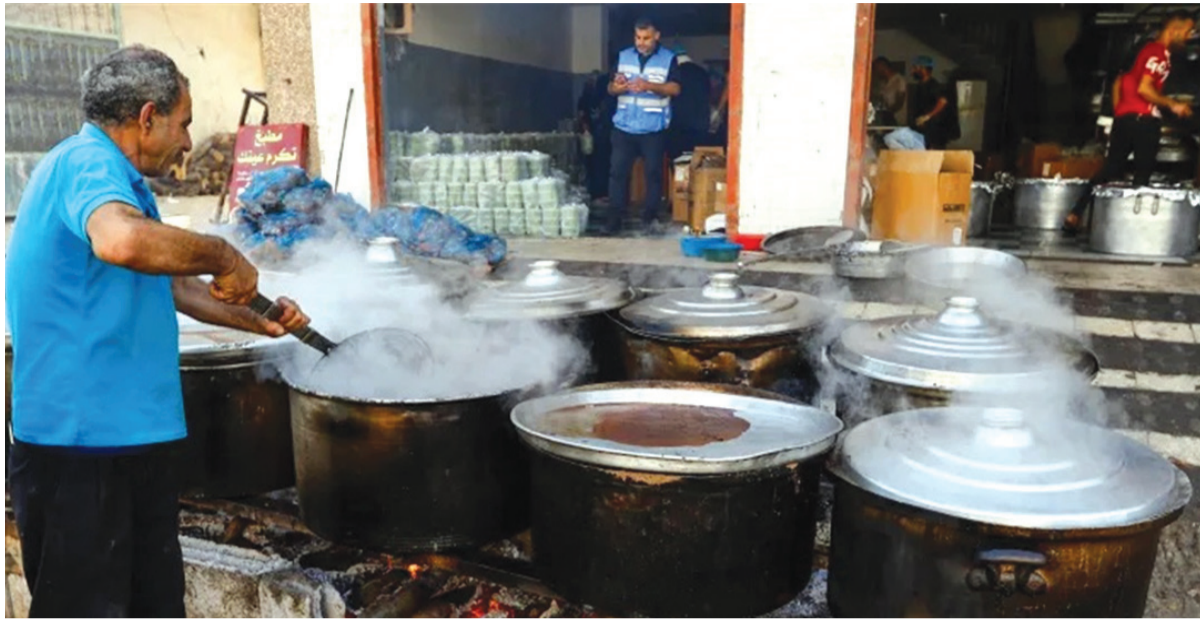
وحتى أدوات المطبخ