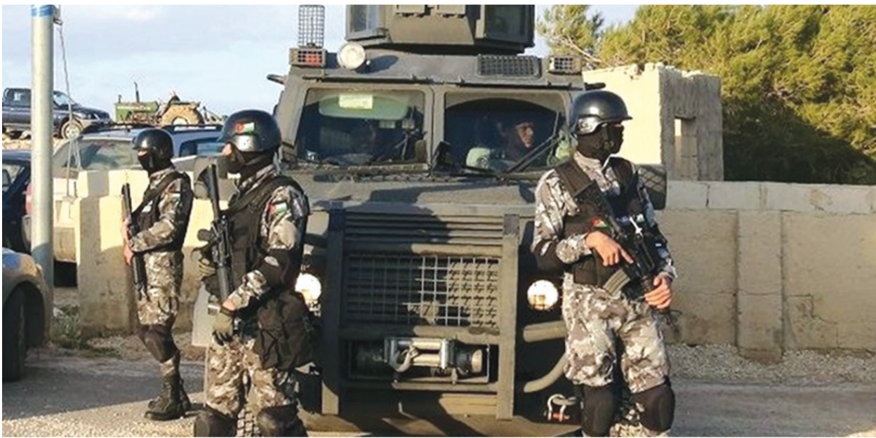
الأنباط - مرح الترك

تشغل الأوساط السياسية والاجتماعية في الأردن كافة بـ التحديث حول العمليات النوعية التي تنفذها الأجهزة الأمنية والعسكرية ضد تجار ومهربو المخدرات في الداخل والخارج، والتي كان آخرها مدهامة فنذها جهاز الأمن العام مؤخراً ضد مهربيين من جنسيات عربية تسللوا عبر الحدود وطبقوا عليهم قواعد الإشتباك القتالية ما أسفر عن قتل أحدهم وإصابة آخر واعتقال الباقيين.