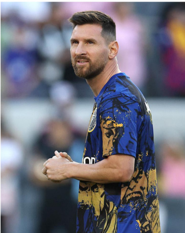
أميركا - وكالات

شباط المقبل، مواجهات قوية بمشاركة انتر ميامي الأمريكي إلى جانب الهلال والنصر. وتجمع هذه الفاعلية عددا كبيرا من نجوم الكرة العالمية في مقدمتهم ليونيل ميسي إضافة إلى نجوم النصر: كريستيانو رونالدو وساديو ماني وتاليسكا، والهلال: ألكسندر ميتروفيتش وحارس المرمى ياسين بونو، وسيرجي ميلينكوفيتش سافيتش. الجدير بالذكر أن نسخة العام الماضي من كأس موسم الرياض جمعت بين فريق نجوم النصر والهلال بقيادة رونالدو وباريس سان جيرمان بقيادة ميسي، وهما الأخير 4-0.