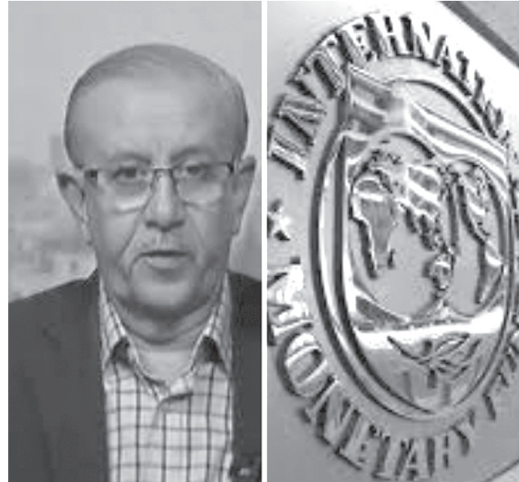
وقطع العقاري، مؤكداً أنه في جميع الأحوال

ورأى عايش، أن استمرار العدوان على غزة بحسب ما تشير إليه التقارير العالمية يجعل من توقعات معدلات النمو وكأنها أرقام ونسب من عدم اليقين وعدم التأكد، في ظل ما تشير إليه مخاطر التوسع في العدوان إلى حرب إقليمية خاصة في القطاعات التي تعتبر روافد اقتصادية تنموية وهامة كالقطاع السياحي، فضلاً عن حملات القاطمة الداخلية لمنتجات وسلع مختلفة، وعلى القطاع التجزئة وعلى القطاعات الفندقية والضيافة وقطاعات النقل