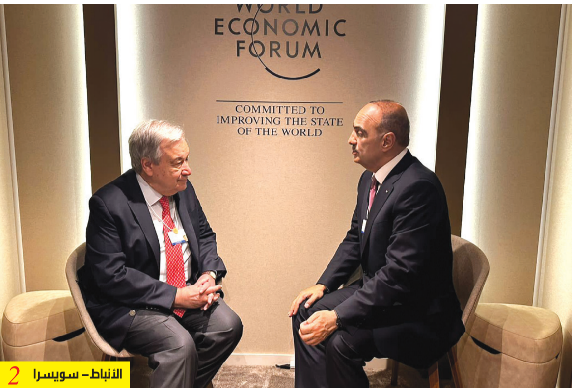
الأنباط - سويسرا 2