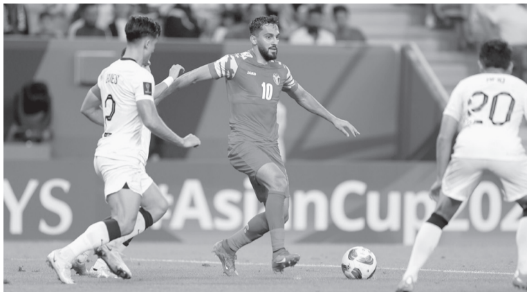
وفد اتحاد الاعلام الرياضي

احتاج المنتخب الوطني لكرة القدم لعام ٧ أشهر من أجل تحقيق أول فوز له في المنافسات الرسمية، بعد رباعية نظيفة جاءت في شبك المنتخب الماليزي، في محطته الأولى بنتهايات كأس آسيا، والذي كسر بها العديد من الأرقام القياسية الإيجابية. وجاء آخر فوز لـ النشأمة، في المنافسات الرسمية، على المنتخب الكويتي في منتصف شهر حزيران من العام ٢٠٢٢، بتصنيفات البطولة المقامة حاليا، ما أدى إلى إحياء الأمل لدى الشارع الرياضي، الذي يخوف من المباراة الأولى لعدم معرفة المنافس بالصورة الكافية، قبل وقوع المنتخب بقلب التوقعات وسعاد أكثر من ٢٠ ألف مشجع تابعوا المباراة من المدرجات. وتمكن المنتخب من الفوز بأربعة أهداف دون مقابل أحرزها كل من محمود مرضى، هديفين، وموسى التعمري، هديفين، في شاني أكبر فوز للمنتخب الوطني بمشاركاته القارية، والانتصار الأكبر في الجولة الأولى بنتهايات كأس آسيا. وأقام المنتخب أمس تدريبا في ساعات الظهيرة، عمد من خلاله الجهاز الفني إلى الاستشفاء من الضغط البدني للاعبين خلال المباراة، وحرصا منه على منحهم فترة أطول للراحة بقية اليوم، إضافة إلى استكمال التدريبات في الأيام المقبلة بالموعد ذاته تقريبا، نظرا لأن المواجهتين المقبلتين في الدور الأول ستقامان عند الساعة الثانية والنصف عصرا. ويلتقي المنتخب الوطني نظيره الكوري الجنوبي السبت المقبل على ستاد الشمامسة، علما بأن كوريا الجنوبية فازت على البحرين بثلاثة أهداف لهدف في الجولة الأولى، ما يرسخ تأهل المنتخب