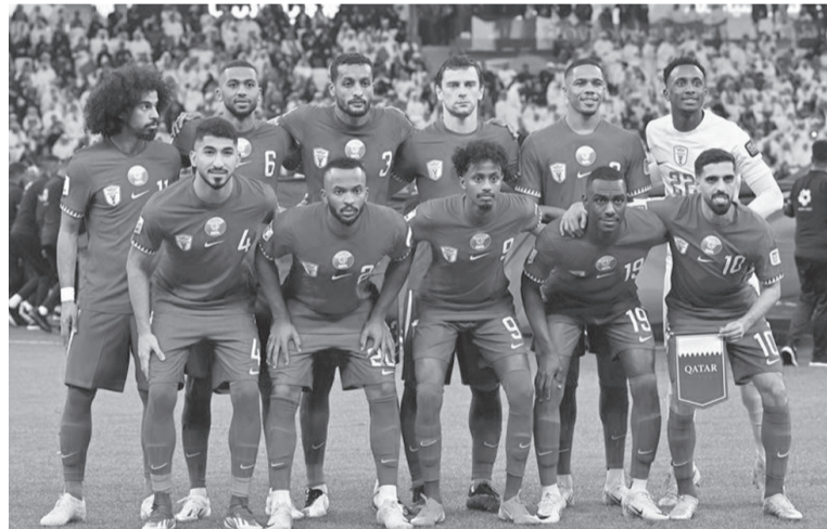
الدوحة - وكالات

سعى للفوز بهما لضمان التأهل للدور التالي، وحذر حسن الهيدوس نجم العنابي من التاريخي أو التهاون في المبارتين المقبلتين، وحرص لوبيز في الأيام الماضية على مشاهدة تسجيلا لمباراة طاجيكستان والصين، للوقوف على نقاط القوة