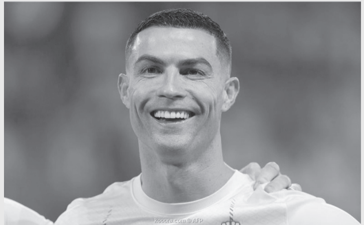
الرياض - وكالات

وكتب رونالدو الذي استأنف تدريباته مع النصر للالتزام مع الإعلان عن جائزة ميسي، عبر إنستغرام: “لقد عدت من أجل المريد“ مع وضع رمز يشير إلى القوة والتحدى. وعاد لاعبو النصر لتدريبات بعد انتهاء إجازتهم التي بدأت مع آخر مباراة خاضوها في العام الماضي، وذلك في ٣٠ ديسمبر/كانون الأول. ونجح ميسي في أن يصبح أكثر لاعب فاز بجائزة “ذا بيست” في التاريخ، بعدما فض الشراكة مع كريستيانو رونالدو وروبرت ليفاندوفسكي نجم برشلونة. وكان رونالدو أول من حصد “ذا بيست” لأفضل لاعب خلال أول سنتين من الجائزة في ٢٠١٦ و٢٠١٧، بينما توج بها ميسي في ٢٠١٩ و٢٠٢٢ و٢٠٢٣.