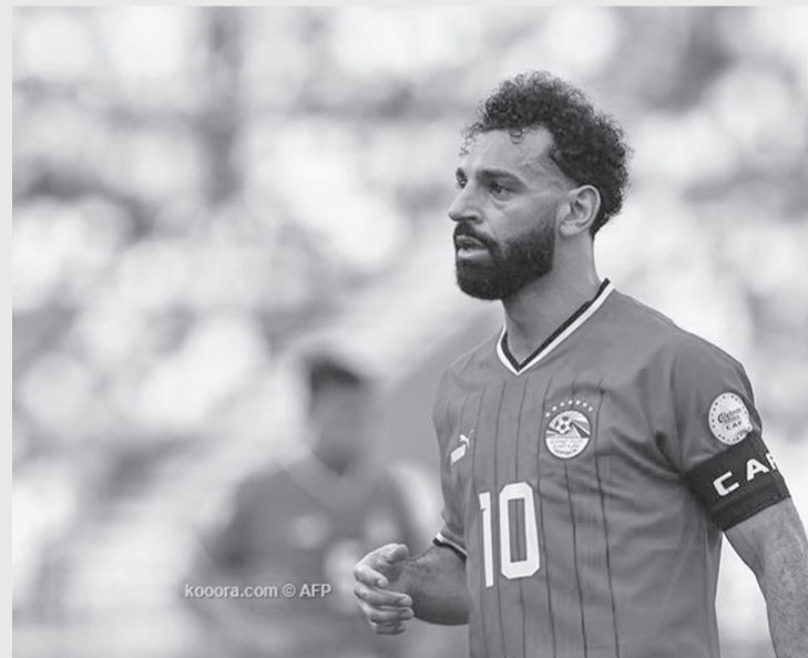
سويسرا - وكالات

أفضل لاعب إلى ليونيل ميسي في الترتيب الأول. ثم جاء كيفين دي بروين ثانيا وإيرلينج هالاند ثالثا، في اختيارات الفرعون المصري. ومنح صلاح الأفضلية في جائزة أفضل حارس إلى إيدرسون حارس المنافس المباشر ليفيربول في البريميرليج، بينما جاء تيبو كورتوا (ريال مدريد) ثانيا، وإيسين بونو حارس الهلال السعودي وأشبيلية السابق ثالثا. وفي اختيارات أفضل مدير فني فضل نجم ليفربول وضع مدربه السابق لوتشيانو سباليتي في المركز الأول، يليه بيب جوارديولا، ثم سيموني إنزاجي.