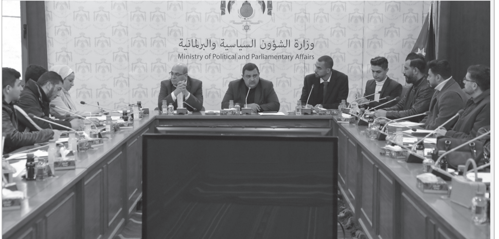
وزارة الشؤون السياسية والبرلمانية Ministry of Political and Parliamentary Affairs