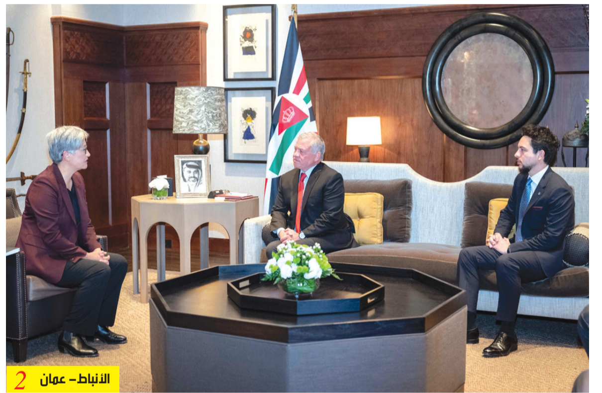
الأنباط - عمان 2