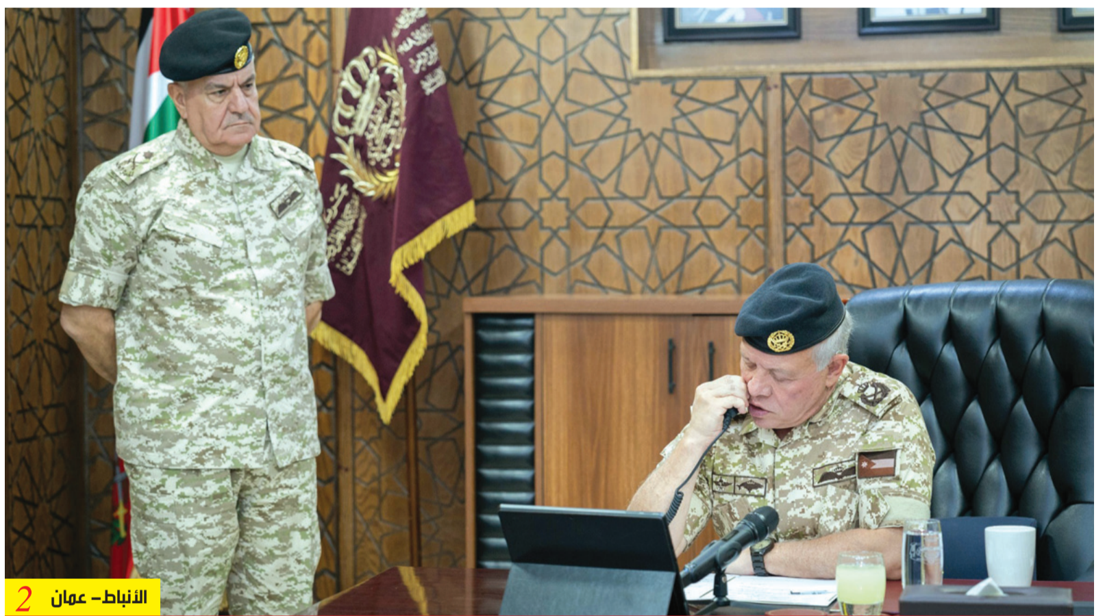
الأنباط - عمان 2

الحيطي: استمرار القيادة العامة بتطوير تشكيلات القوات المسلحة ووحداتها