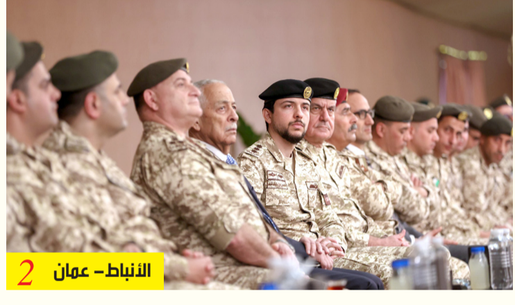
الأنباط - عمان 2