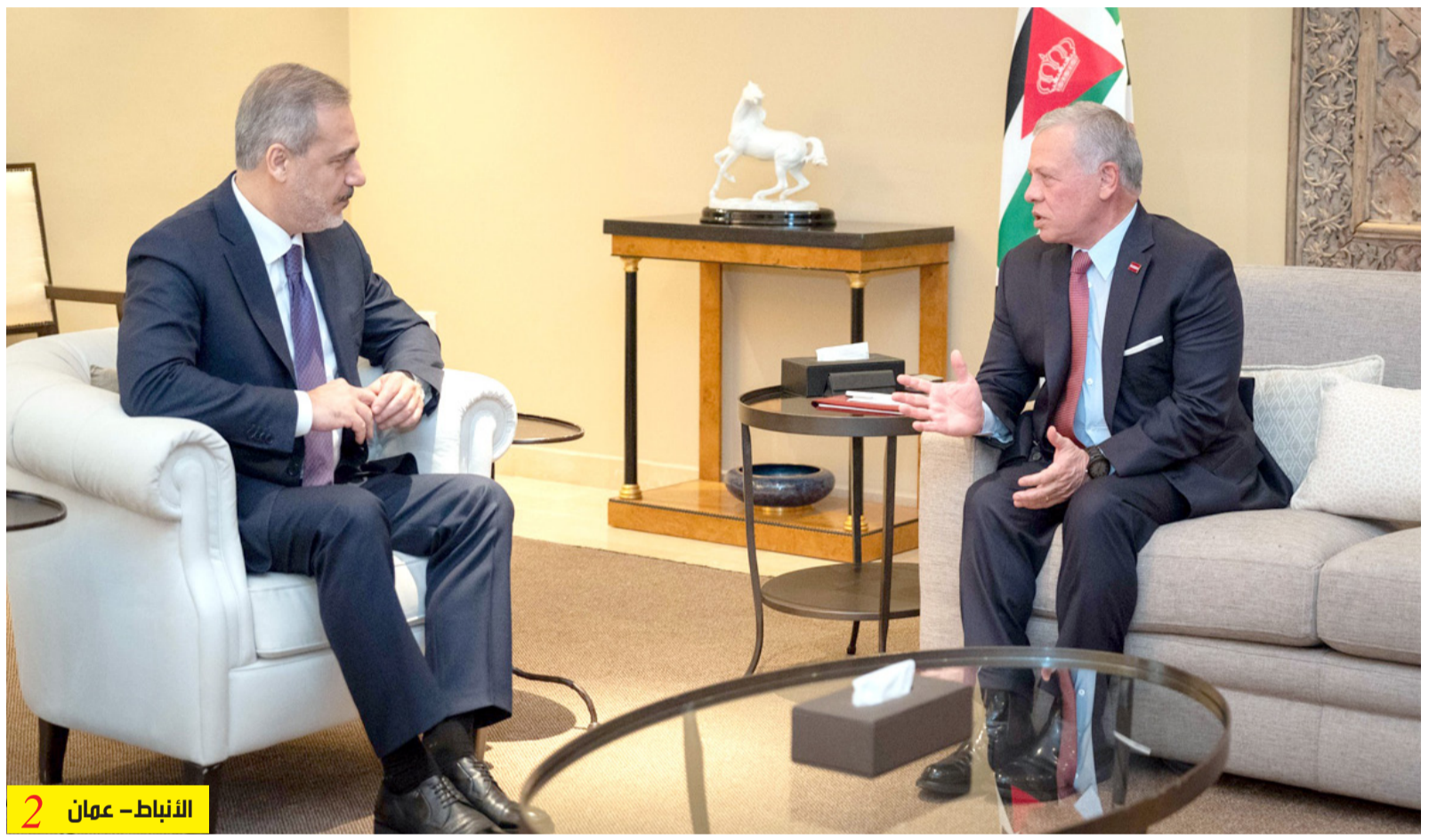
الأنباط - عمان 2