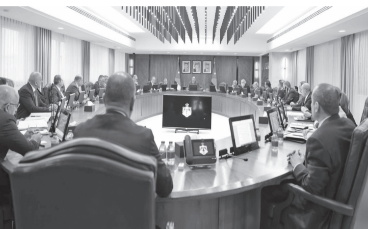
على صعيد آخر، قرّر مجلس الوزراء إصدار طابع بريدي بمناسبة «يوم مدينة عمان» عام 2024.