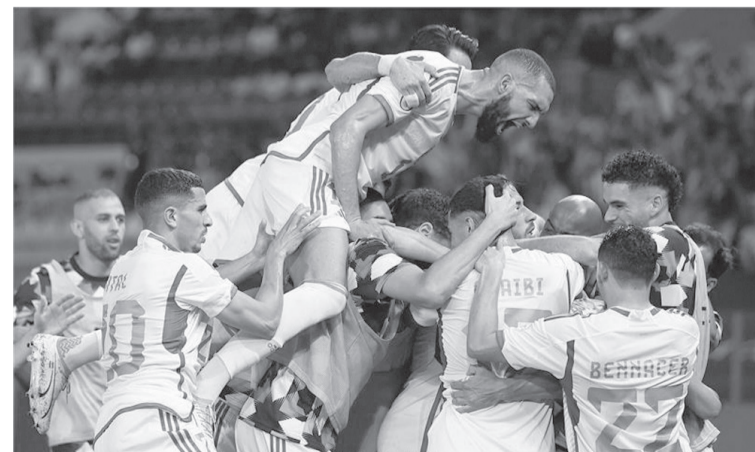
ساحل العاج - وكالات

النظر إلى فارق الأهداف بين الفرق الثلاثة لحسم التأهلين. أما في حال تعادل الجزائر مع موريتانيا، وأيا ما كانت نتيجة المباراة الثانية، سيعني هذا بقاء موريتانيا في ذيل ترتيب المجموعة وخروجه من الدور الأول للمرة