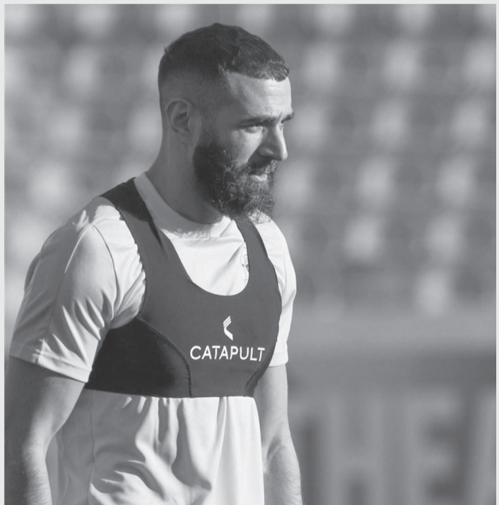
الرياض - وكالات

” سيتم عقد المزيد من الاجتماعات قريباً لناقشة مستقبل كريم بنزيم. الوضع ما يزال متوتراً مع الاتحاد، وأوضح: ” مسؤولو رابطة المحترفين يريدون بقاء كريم بنزيم في السعودية، وإن كان ذلك عبر بوابة ناد سعودي آخر. وأتم: ” لا يمكن لبنزيم العودة إلى أوروبا إلا من خلال تخفيض كبير في راتبه. وكان بنزيم انضم لفريق الاتحاد حامل لقب الدوري السعودي للمحترفين، خلال فترة الانتقالات الصيفية الماضية، عقب انتهاء تعاقد مع ريال مدريد.