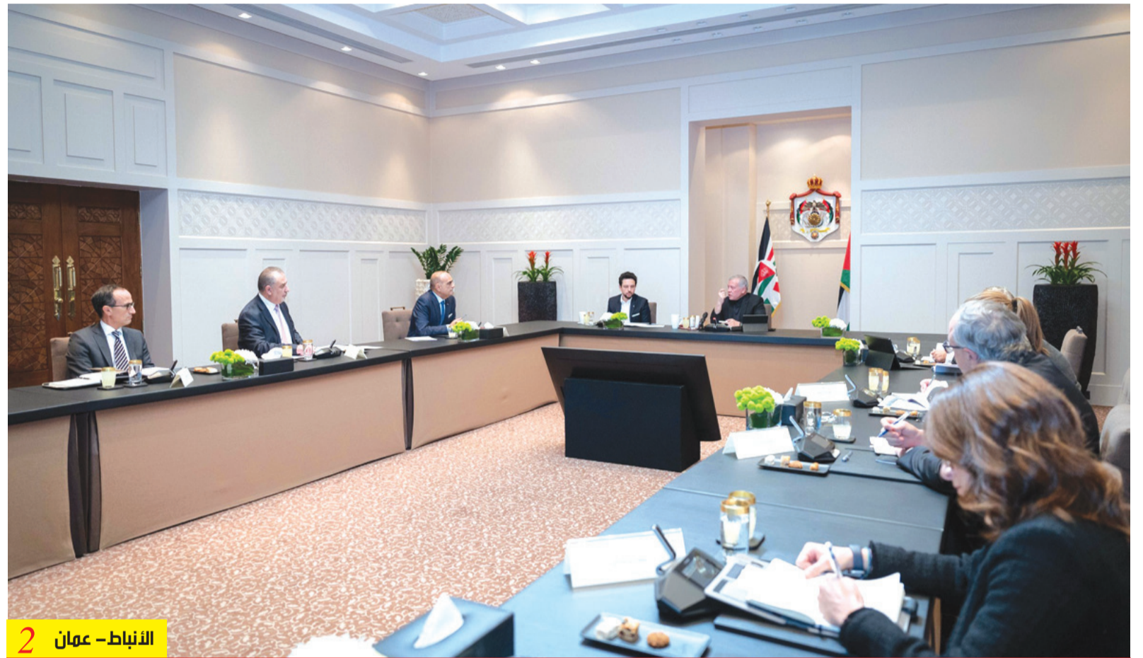
الأنباط - عمان 2

أهمية ضمان إنجاز مشروع الناقل الوطني للمياه قبل نهاية العقد الحالي