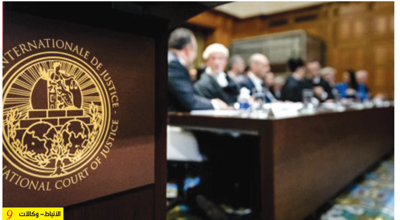
الأنباط - وكالات 9

دبلوماسيون: أغلبية «لاهاي» تحرج دول الفيتو التي تدعي العدالة