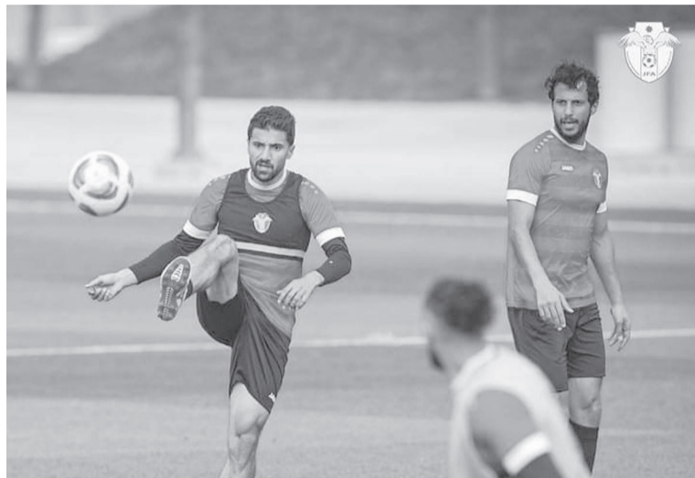
الدوحة - وفد اتحاد الاعلام الرياضي

يتصاعد الترقب والانتظار للمواجهة التي تجمع المنتخب الوطني لكرة القدم ونظيره العراقي، في دور الـ ١٦ من بطولة كأس آسيا قطر ٢٠٢٤. الحرس القارئ الدائر هذه الأيام في العاصمة القطرية، تتطلق منافسات دوره الثاني اليوم بمباراة تجمع المنتخب الاسترالي ونظيره الإندونيسي عند الثانية والنصف على ستاد جاسم بن حمد، وفي اللقاء الثاني تلعب الإمارات ضد طاجيكستان بstad أحمد بن علي عند الساعة مساءً، ويرتفع مؤشر الشغف لحدوده القصوى، فداءً عند الثانية والنصف من بعد الظهر، عندما يظهر منتخب النشامى في ستاد خليفة الدولي، وهو يواجه نظيره العراقي في لقاء عربي منتظر. المباراة وباختصار، هي لقاء شبه كلاسيكي بين منتخبين شقيقين يعرفان بعضهما البعض بشكل جيد، وليس بالفريب عنهم أن يكونا النديين اللذين اعتادا على المواجهات البيئية كثيرا بالإضافة الى تقابلهما بشكل ودي متكرر وفي دورات وبطولات محلية وعربية عدة. هي مباراة من نوع خاص في هذه البطولة بالتحديد، لماذا؟ للإجابة على هذا السؤال، يتبادر إلى أذهاننا التندية والسخونة التي تغلف أجواء المنتخبين وما اعداد لتهذه الموقعة والمستوى الفني الذي وصل به لهذا الدور من بطولة تعتبر الأولى والأهم في الفارة، وما يعزز تلك الإشارات بأن المواجهة ستكون على قدر عالٍ من الأهمية، كونها مواجهة إقصائية والخطأ فيها غير مسموح والخايز منها سيعبر لدور الـ، وهو المرحلة التي تمكن أن ترى "الكأس" من خلالها، بالإضافة إلى العديد من الميزات المعززة للسمعة الكروية محليا، عربيا، قاريا وعالميا كذلك. المواجهة كبيرة وحساسة بدأت الوقت، وهذا ما تدلل عليه عديد التصريحات التي خرجت من مجلس هنا وبرنامج