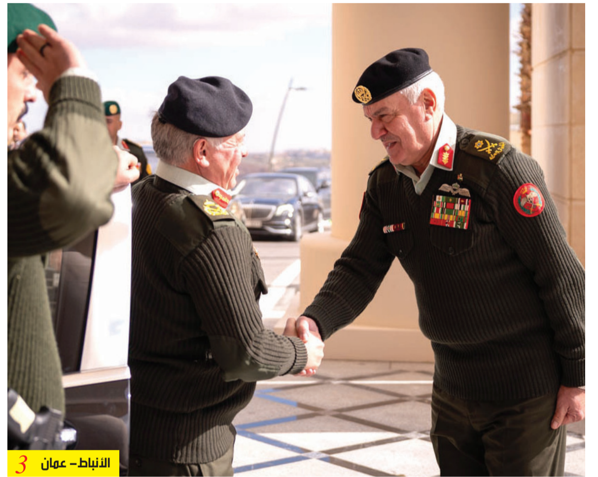
الأنباط - عمان 3