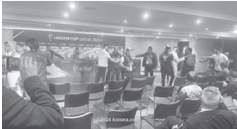
الدوحة - وكالات

أصرب الاتحاد الآسيوي لكرة القدم عن خيبة أمل كبيرة نتيجة التصرفات التي شهدتها المؤتمر الصحفي لمباراة العراق والأردن بمحاولة الاعتداء على مدرب أسود الراقدين خيسوس كاساس. وفاز منتخب الأردن على نظيره العراقي ٣-٢، ضمن منافسات دور ال ١٦ من كأس آسيا، المقامة حالياً في قطر. وأشار الاتحاد، خلال بيان له: "ندين بقوة أي تصرفات مزعجة وعدائية، حيث يتخذ الاتحاد موقفاً لا يتهاون في مواجهة مثل هذه التصرفات، وندومن بتوفير بيئة يمكن خلالها أن يشارك الصحفيون في عملهم المهم بتغطية المنافسات، باحتراف وياحترام متبادل، وأضاف: "يشعر الاتحاد بخيبة أمل كبيرة نتيجة