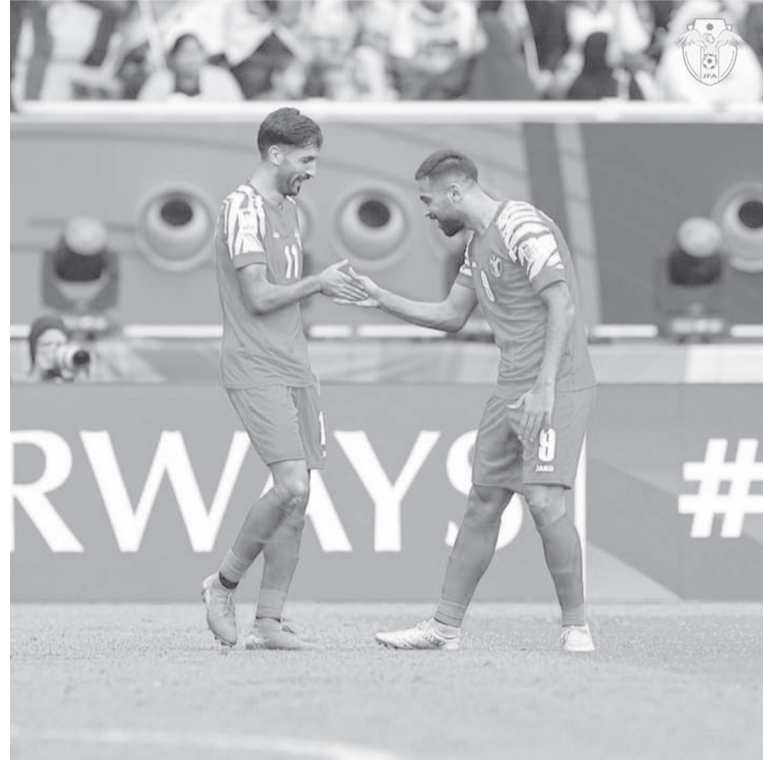
الدوحة - وفد اتحاد الاعلام الرياضي

نشر الفوز الذي استحقه المنتخب الوطني لكرة القدم على المنتخب العراقي بدور الستة عشر، والتأهل الذي انجزه بالوصول إلى دور ال ٨ من بطولة كأس آسيا "قطر ٢٠٢٣"، الفرح والبهجة في المملكة، وبث ذلك الإنجاز هالات من الغبطة وهي تمتاز باحتفالات الأردن بمناسبة عيد ميلاد جلالة الملك عبدالله الثاني ابن الحسين، قائد المسيرة بعيد ميلاده الميمون. الفرحة المشروعة التي طالت نوايا الوطن، لم تأتي محض صدفة، ولكنها كانت مستترة خلف إصرار النشامى لاعبي المنتخب - وعزيمتهم التي راهن عليها الكثيرون في عالم كرة القدم، وهم أثبتوا أن المستحيل لا يعرف الطريق إلى قلوب الأردنيين إذا ما أرادوا وعقدوا العزم على الإنجاز وتحقيق الأحلام في كل المجالات وبكرة القدم على وجه الخصوص. قبل البطولة، وبعد أن استلم المدرب المغربي الحسين عموتا دفة قيادة المنتخب، تبين الأمر ودخل الشك في فهرس قاموس كلمات المنتخب، وكانت نتائج التجارب الودية التي سلكتها المنتخب في خطة اعداده وتحضيره من قبل الجهاز الفني سلبية إلى حد وضع النشامى في دائرة الشك والتوقفات والسيناريوهات المزعجة، ولكن ما أن بدأ الجد ودخل المنتخب غمار النهائيات القارية النامية في العاصمة القطرية الدوحة على الملاعب الموندالية، كان الانقلاب عكسياً والصورة غير الصورة، ومن هنا أثبت النشامى مقولة "كل مجتهد نصيب"، وأن الإصرار على الإنجاز لا يأتي إلا بالانضباط والعزيمة وحب الوطن وتمثيله خير تمثيل في مثل هذه المحافل العالمية. المنتخب وهو يتابع اليوم تحضيراته الفنية والبدنية، يقف ويقف معه الشعب الأردني، بل وينتظره على أحر من الجمر، متابعة الإبداع والامتناع يوم الجمعة المقبل في استاد أحمد بن علي، وهو يواجه المنتخب الطاجيكستاني في ربع النهائي والأمل يحده بل ويسبقه إلى