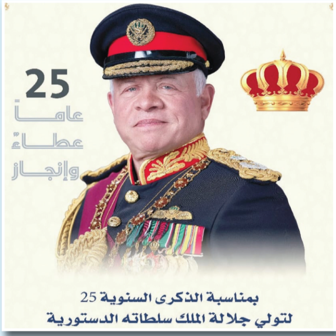
بمناسبة الذكرى السنوية 25 لتولي جلالة الملك سلطاته الدستورية

عشائر العوامله تهني جلالة الملك عبدالله الثاني ابن الحسين باليوبيل الفضي لتولي جلالته سلطاته الدستورية ينتشر في ديوان عشيرة العوامله بأسمى آيات التهنئة والتبريك من مقام سيدي صاحب الجلالة الهاشمية الملك عبد الله الثاني ابن الحسين المعظم بمناسبة الذكرى (٢٥) لتولي جلالته سلطاته الدستورية مؤكدين ومجددين الولاء والإخلاص للقيادة الهاشمية الحكيمة.