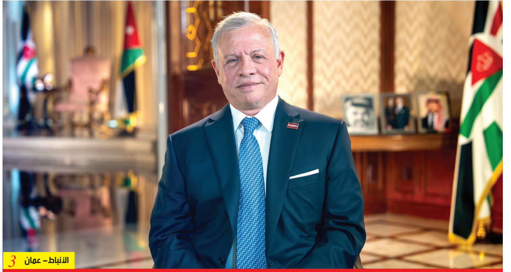
الأنباط - عمان 3

مصاحبة شعبنا ووطننا قبل أي شيء وفوق كل شيء