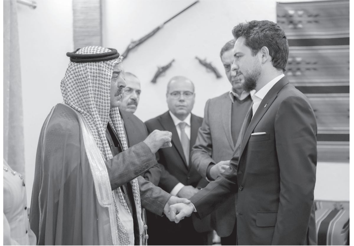
الأنباط - المفرق

التقى سمو الأمير الحسين بن عبدالله الثاني، ولي العهد، أمس الأربعاء، مجموعة من وجهاء قصبه المفرق بمنزل الشيخ خالد نواف العيطان، في منطقة رحاب بمحافظة المفرق.