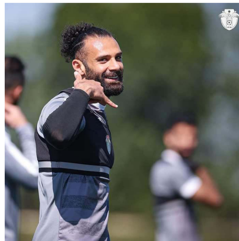
الدوحة - وفد اتحاد الإعلام الرياضي

وجهاً لوجه، ونجح النشامى في الفوز ذهاباً بهدف نظيف، وفي لقاء الإياب فازت قطر بهدفين نظيفين سجلهما مسعد الحمد ونايف خاطر. وأقيمت مباراة ودية يوم آذار، فاز فيها القطري بهدفين مقابل هدف، وسجل للعنابي سياستيان سوريا وماجد محمد، فيما سجل للنشامى عدي الصيفي، وضمن منافسات بطولة اتحاد غرب آسيا ٢٠٠٨، فاز النشامى بثلاثية نظيفة في مواجهة نصف النهائي للبطولة، وسجل للنشامى حسونة الشيخ وعامر ذيب وعدي الصيفي، ثم أقيمت مواجهة ودية أخرى في تشرين الأول ٢٠١٢، وانتهت بالتعادل الإيجابي ١-١، وسجل حسن عبدالفتاح للمنتخب، فيما للعنابي سجل ماجد محمد حسن، وفي بطولة اتحاد غرب آسيا ٢٠١٤، فازت قطر ٢-٠ في المباراة النهائية، حيث قاد النجم الشهير خوخي بوعلام العنابي للتتويج باللقب الذي أقيم في الدوحة. ولعب المنتخبان ٣ مباريات ودية خلال الأعوام الماضية في ظل عدم وجود ارتباطات رسمية في المنافسات المختلفة، وكانت المواجهة الودية الأولى بينهما بعد بطولة غرب آسيا، في آب وحقت قطر الانتصار بثلاثة أهداف لهدفين. وبعدها بعامين حضرته ودية أخرى نهاية عام ٢٠١٨، وفازت قطر ٢-٠. وفي المواجهة الودية الأخيرة بينهما، قبل النهائيات الجارية، فقد دانت النتيجة للنشامى ١-٢، وسجل للمنتخب يزن النعيمات وعلي علوان، ولقطر أكرم عفيف.