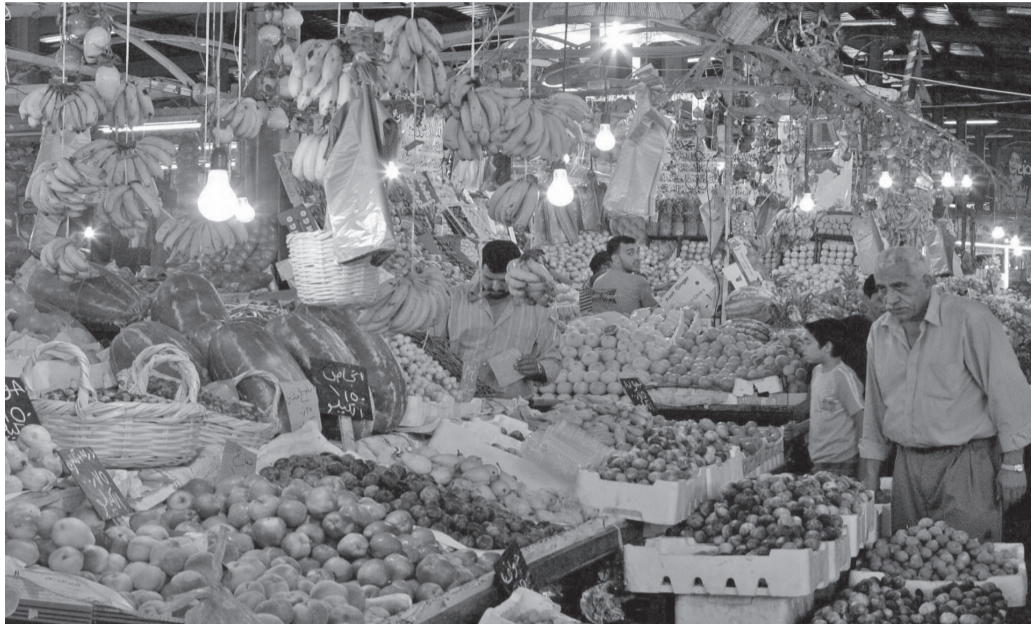
الأنباط – مينا س بني ياسين

واكدت دعمها لقرارات الوزارة والتي تدعم توفير العملة الصعبة والاكتفاء الذاتي .