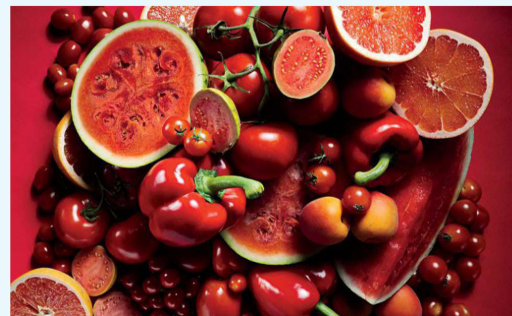
المثال، يساعد في مكافحة أمراض القلب ويحمي صحة القلب.