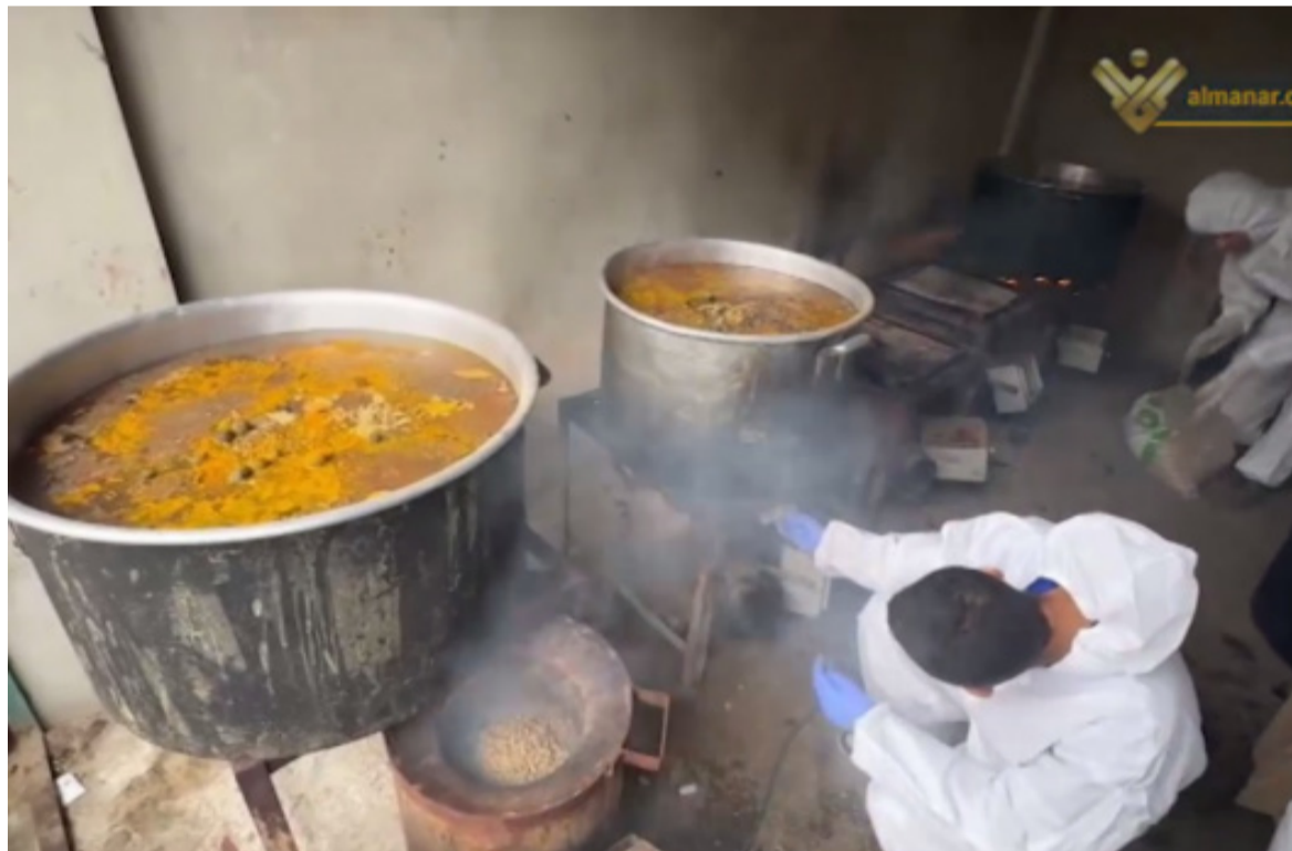
الفلسطينيون إلى الصيادية وهي أكلة فلسطينية تتكون من سمك التونة والأرز، كبديل عن اللحوم والدجاج بعد شح وإفقار الأسواق إلى

اللحوم وارتفاع أسعارها 5 أضعاف سعرها مقارنة بفترة ما قبل الحرب. وكان قد حذر المكتب الإعلامي الحكومي في غزة، من أن المجاعة في شمال غزة تتصاعد بعد فساد كميات الطحين والأرز والطعام والغذاء، وكذلك فساد حيوب وأغلاف الحيوانات. وإنه المكتب في بيان له إلى أن كل دول العالم أمام مسؤولية أخلاقية وإنسانية تجاه هذه الجريمة القدرية التي يمارسها الإحتلال بدعم أمريكي كامل. وطالب المكتب الإعلامي بإدخال 1000 شاحنة يومياً، بشكل فوري وعاجل، لمحافظة شمال غزة حتى تتعافى من المجاعة وأثارها. ويُعاني سكان قطاع غزة عموماً، ومواطنو الشمال ومدينة غزة خصوصاً من حصار شامل بالترزامن مع حرب الإبادة الجماعية. ومنذ بداية العام الحالي، وعلى الرغم من تشغيل عدد من أفران الخبز، إلا أن الكثافة السكانية العالية الموجودة في مدينتي دير البلح ورفح، بسبب نزوح مئات الآلاف من مختلف أنحاء قطاع غزة إلى هاتين المدينتين، جعلت الحصول على رطله خبز مهمة شاقة تحتاج إلى ساعات طويلة من الانتظار. ويضطر المواطنون إلى الانتظار لما يقارب 6 ساعات بشكل يومي للحصول على قليل من الخبز.