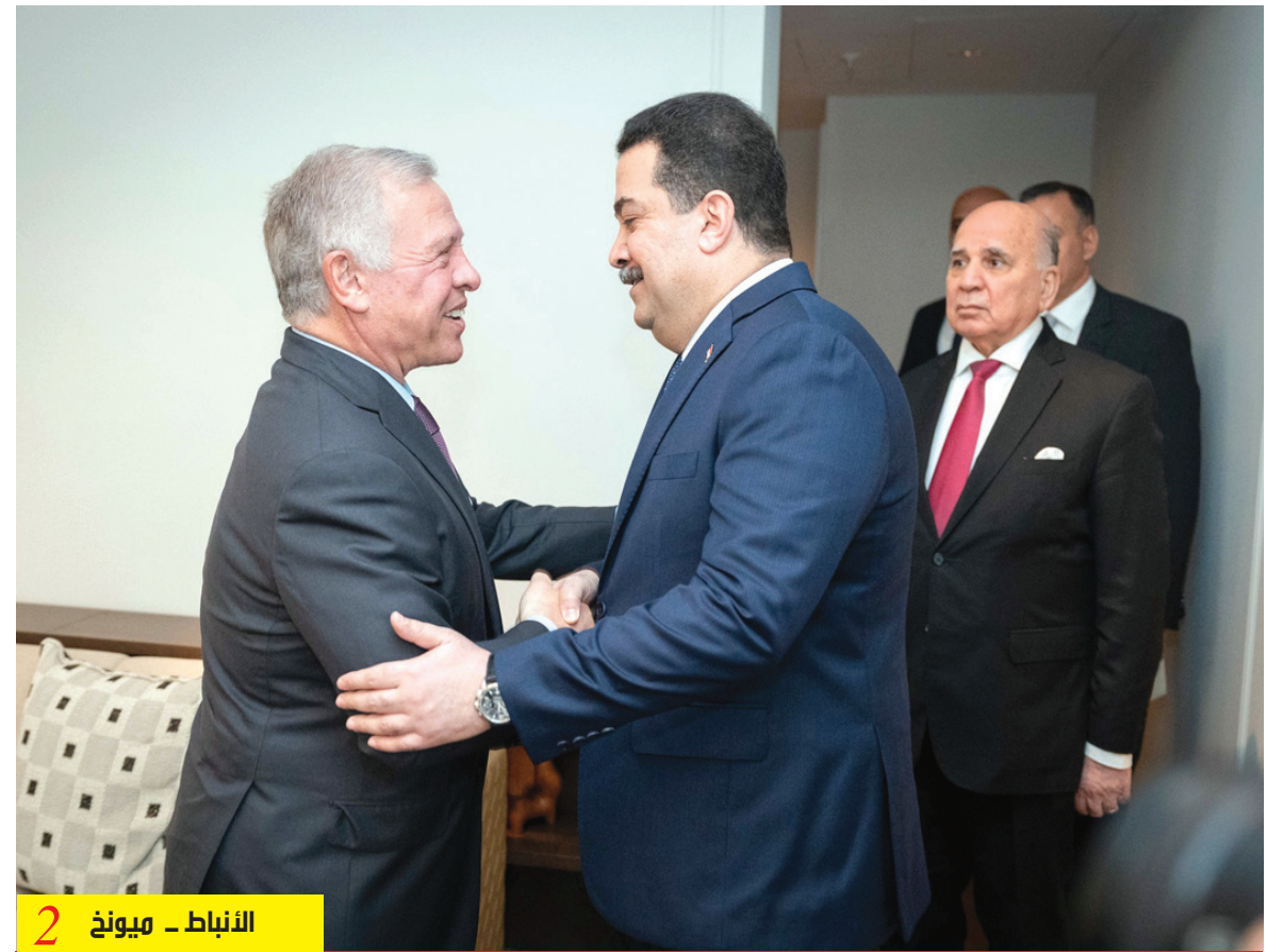
الأنباط - ميونخ 2

ضرورة ضمان إيصال المساعدات إلى جميع أنحاء غزة