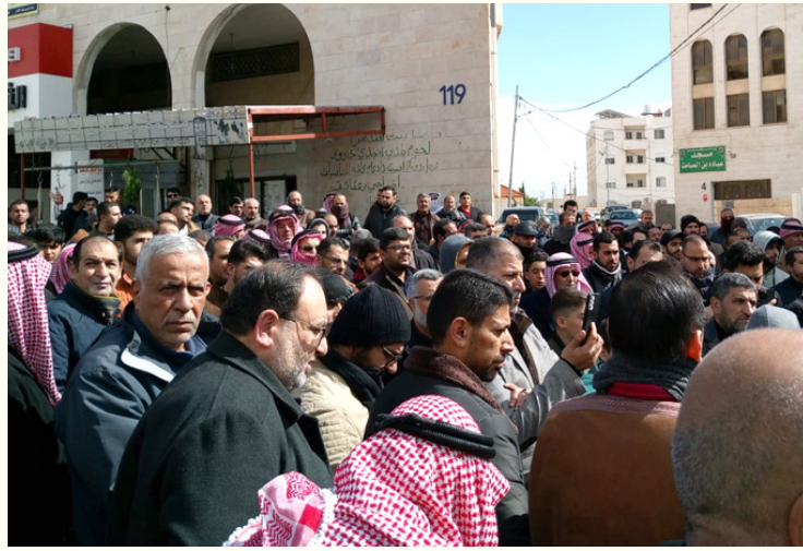
مؤسسات السلطة، اجهضت طموح رجال الدولة، بل وخذلتهم في مواقع متعددة، بانحيازها الى اشباه الساسة والمتقنين والفكرين.

في اللحظة التي يقف فيها الملك على منابر عالمية، ليقدم موقفا وطنيا وقوميا متقدما عن الساسة العرب والاقليميين، الامر الذي دفع قنوات امريكية الى حجبها عن شاشاتها، كما يقول المعارض محمد المحادين في تغريدته له، يقف شاب على ناصية اردنية، ليتهف بهتاف خشن، وتحاول سيدات التحرش برجال الامن، في استمرار لمشهد كنا نخاله سرايا، قبل ان تظهر ملامح تأسيس وتظهير، لحالة تحتاج الى قراءة عميقة، بين خطاب الخارج وسلوك الداخل، الذي لا تصل اليه رسائل رأس الدولة، او انه مسكون ومخطوف لصالح خطاب مضاد، له اسباب متعددة كما يقول سياسيون ومتابعون، يرون ان