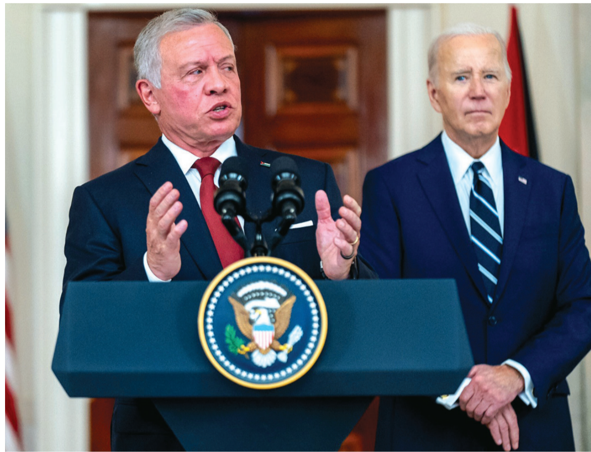
الأنباط - خليل النظمي

الأنباط - عمان قدم جلالته الملك عبد الله الثاني للرأي العام العالمي، وبالتحديد الأميركي، خلال جولته الأخيرة، التي شملت الولايات المتحدة الأمريكية وكندا والمملكة المتحدة وفرنسا وألمانيا، وصفاً دقيقاً لكل ما يجري في الأراضي الفلسطينية المحتلة من انتهاكات، والبضاعة التي ارتكبت بحق الإنسان في قطاع غزة عبر ١٣ يوماً والتي فاقت كل تصورات البشر. على منصات التواصل الاجتماعي، وعلى