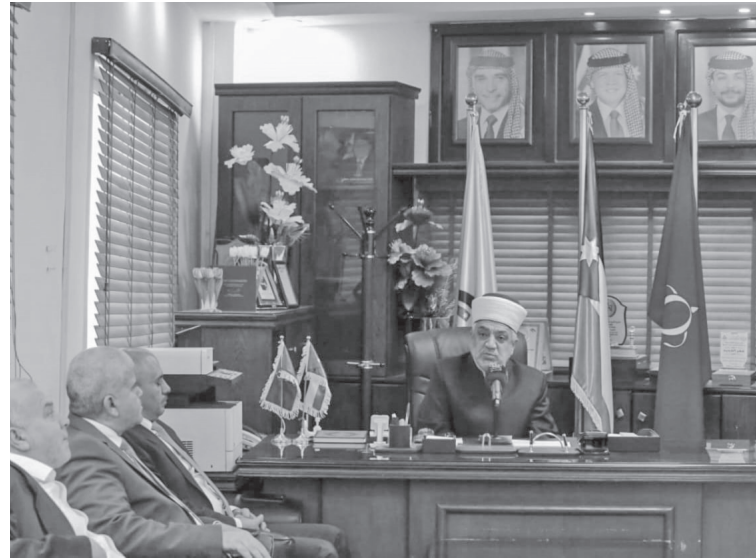
الاعاقة في الانتخابات والإجراءات الخاصة بالعملية الانتخابية وضرورة توفير كافة وسائل التوعية بطرق مهية للأشخاص ذوي الإعاقة.

ومعاناة اليوم هي في تعديل المعادلة حتى تأخذ مكانها الصحيح في الحياة ، ويعود الإنسان منتجا للحضارة والفكر ، وليس مستهلكا لعالم الأشياء .