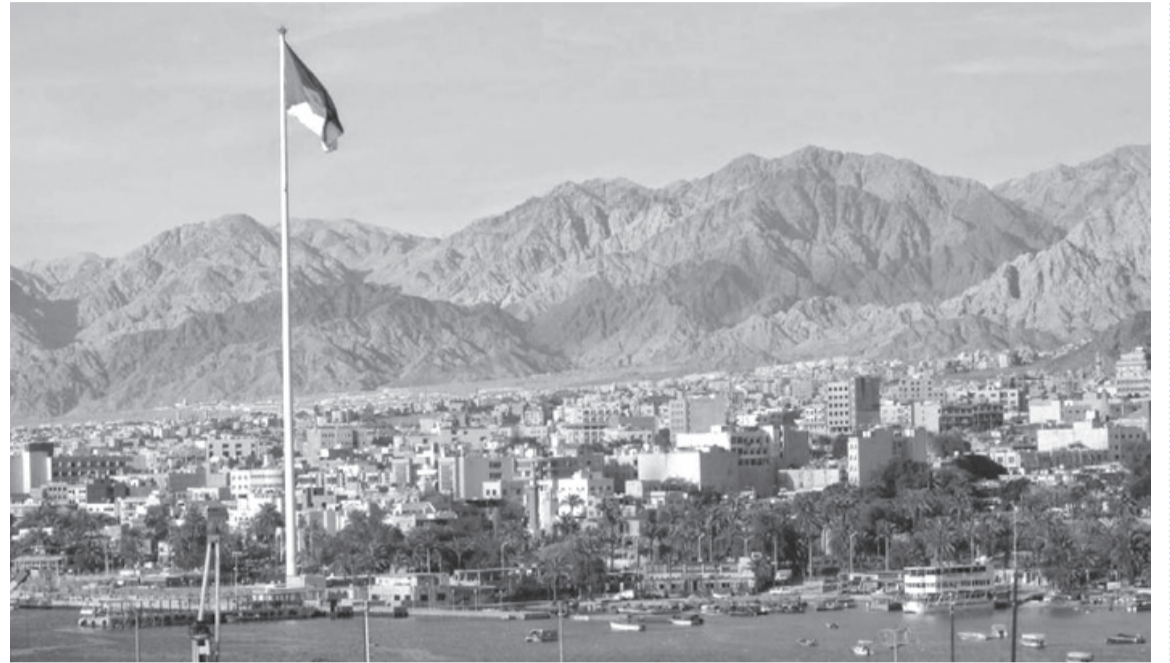
الأنباط - دينا محادين