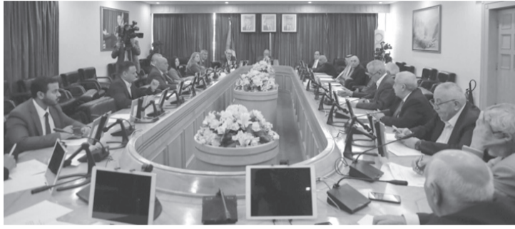
نبض البلد- عمان

للضريبة العامة على المبيعات بنسبة "صفر"، بمقتضى نظام يصدر لهذه الغاية.